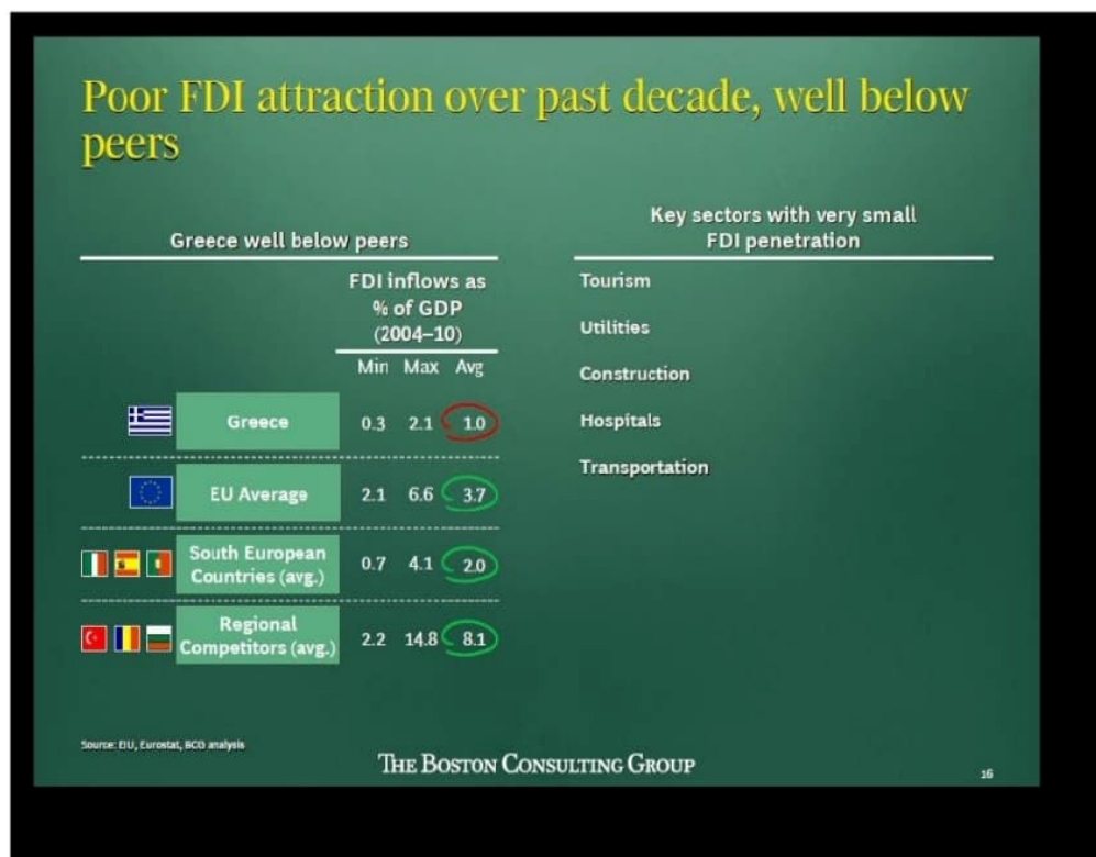
ΠΙΝΑΚΑΣ 10 :ΧΑΜΗΛΗ ΘΕΣΗ ΣΕ ΕΙΣΡΟΕΣ ΤΗΣ ΕΛΛΑΔΑΣ ΣΕ ΣΥΓΚΡΙΣΗ ΜΕ ΑΛΛΕΣ ΧΩΡΕΣ