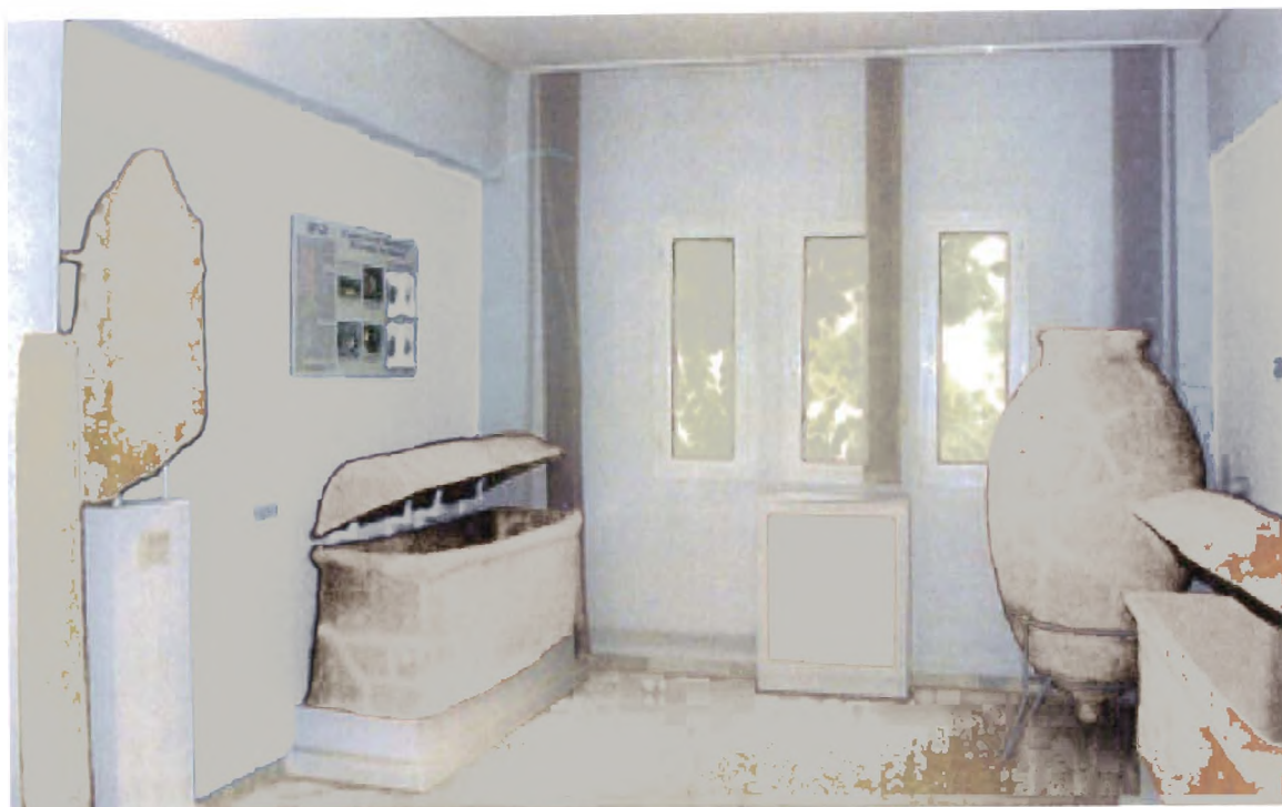
Αρχαιολογικό Μουσείο Κέδρου