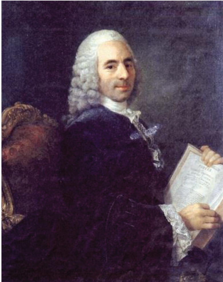
ΦΡΑΝΣΟΥΑ ΚΕΝΕ (1694-1774)

Οι φυσιοκράτες, υποστηρίζουν ότι η ευημερία όλων των κοινωνικών τάξεων, οφείλεται στην πρωτογενή παραγωγή, στην εκμετάλλευση της γης και της αγροτικής παραγωγής. Η μακροχρόνια οικονομική ανάπτυξη, έχει την βάση της στην αύξηση της παραγωγικότητας των αγροτικών προϊόντων, προσφέροντας στην συνέχεια πλούτο και ανάπτυξη στην κοινωνία, όπως είναι η αύξηση του χώρου και του πληθυσμού, η δημιουργία της τάξης των διανοούμενων και του διαφωτισμού και συνακόλουθα των επιστημών της βιομηχανίας, της βιομηχανικής παραγωγής και της αναβάθμισης των υπηρεσιών μέχρι και σήμερα. 3