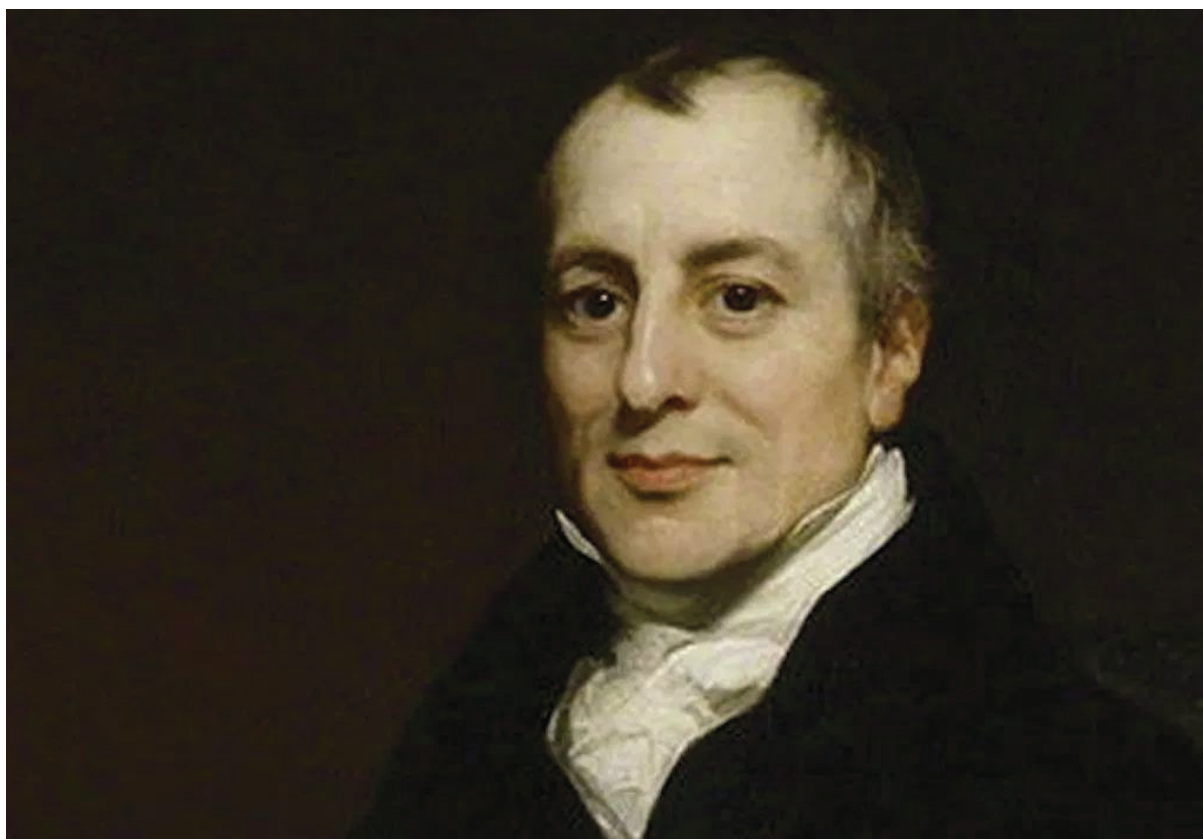
David Ricardo (1772-1823)

Σε μια πιο γενική εκτίμηση, οι απόψεις των οικονομολόγων της εποχής διαφέρουν αρκετά ως προς τις φιλοσοφίες του μερκαντιλισμού. Συμφωνούν, παρόλα αυτά σε αυτό που συμπεράνε ο Σμιθ, ότι ο εμποροκρατισμός πέρασε από δυο οικονομικές φάσεις, την προώθηση των εξαγωγών και ταυτόχρονα της αποθάρρυνσης των εισαγωγών, εκτός των απαραίτητων αγαθών. Το σύστημα αυτό είχε υιοθετηθεί από την Βρετανική Αυτοκρατορία ήδη από τον 17ο αιώνα, με τους περίφημους Νόμους της Ναυσιπλοΐας, που απέβλεπαν τόσο στη στρατηγική όσο και στην οικονομική ισχύ της Αυτοκρατορίας. Καταργήθηκαν από τον Κολμπέρτ (J. B. Colbert) , ο οποίος ήταν λιγότερο υποστηρικτής της θεωρίας του εμπορικού ισοζυγίου και ενίσχυε περισσότερο τα θέματα που αφορούσαν τις ρυθμίσεις της βιομηχανίας. 8