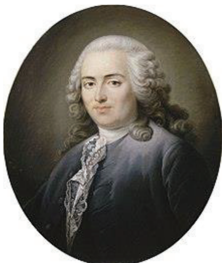
Anne Robert Jacques Turgot (1727-1781)

Το σύνθημα “laissez faire” διαδόθηκε από τον Γάλλο Φυσιοκράτη Βενσάν ντε Γκουρναί (Vincent de Gournay), βασιλικό επίτροπο, επηρεασμένο από την θεωρία του Κενέ σχετικά με το κινέζικο πρότυπο. Ο Γκουρναί, την δεκαετία του 1750, ενθουσιάστηκε από τον ανεκδοτολογικό διάλογο των Κολμπέρ-ΛεΖέντρ και αφομοίωσε το σύνθημα “laissez faire”, που σημαίνει “αφήστε να δημιουργηθούν και αφήστε να ρέυσουν”. Ο Γκουρναί, υπήρξε ένθερμος υποστηρικτής της κατάργησης των περιορισμών στο εμπόριο και της άρσης του κρατικού ελέγχου στην βιομηχανία της Γαλλίας. 31