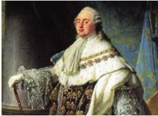
Βασιλιάς Λουδοβίκος XVI (1754-1793)

Η Τουργκό, εξέθεσε σχεδόν αμέσως διάταγμα, προκειμένου να υπάρξει ελεύθερο εμπόριο σιτηρών, το οποίο, όμως, δεν τέθηκε ποτέ σε εφαρμογή. Συνάντησε μεγάλη επίθεση από την αντιπολίτευση και όχι μόνο, ενώ η κακή σοδειά σιτηρών του 1774, δεν άφησε να γίνει δυνατή η πρακτική αυτού του διατάγματος. Παράλληλα, η Τουργκό, παρουσίασε τα Έξι Δείγματα, τα οποία είχαν ως αντικείμενο την επιεική φορολογία και την κατάργηση του προνομίου του ίδιου του βασιλιά απέναντι σε αυτή. Τα διατάγματα αυτά, εγκρίθηκε το 1776, αλλά η εναντίωση των ευγενών και του κοινοβουλίου, ήταν αρκετά έντονη, με αποτέλεσμα να προχωρήσει σε πρακτικό στάδιο. Ίσως τα πράγματα να είχαν πάρει διαφορετική τροπή, αν η Τουργκό είχε κρατήσει μια πιο διπλωματική στάση και είχε δημιουργήσει σχέση εμπιστοσύνης με τον βασιλιά και τους υπόλοιπους Υπουργούς. 48