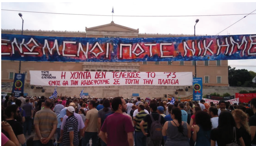
Εικόνα 8. Συγκέντρωση των Αγανακτισμένων έξω από την Βουλή.