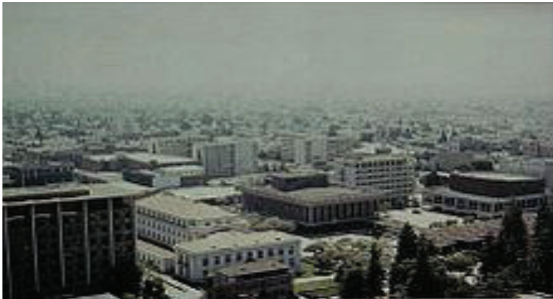
Εικόνα 5. Αεροφωτογραφία του Sproul Plaza από το 1978. Η φοιτητική ένωση και η πύλη Sather είναι ορατά στην κάτω δεξιά γωνία.