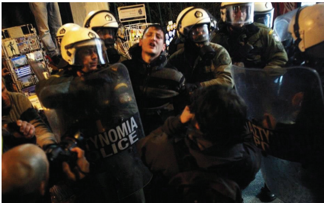
Εικόνα 12. Συλλήψεις κατά την διάρκεια επεισοδίων σε διαδήλωση των Αγανακτισμένων.

Η οικονομική κρίση λοιπόν που αποσύρει πολλές φορές την ομόνοια και την ειρήνη από τον χώρο στον οποίο δραστηριοποιείται παίρνοντας πολλές μορφές μιλώντας για ανέχεια, φτώχεια και προβληματική πολλές φορές υγειονομική περίθαλψη, μπορεί πάντα να αντιμετωπιστεί με τα κατάλληλα πολιτικά πρόσωπα, με επίμονες ειρηνικές εξεγέρσεις του λαού και την σημαντική διάρκεια και ομόνοια στη χώρα.