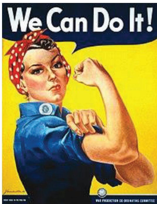
Εικόνα 1. Αφίσα προώθησης Φεμινισμού Εποχής