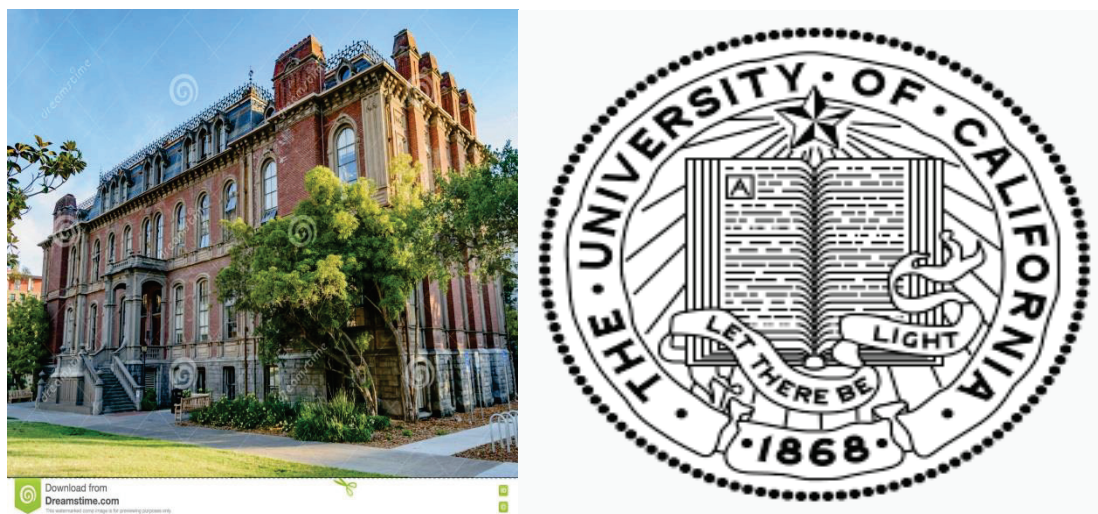
Εικόνα 4. Το Πανεπιστήμιο της Καλιφόρνιας (αριστερά), Σφραγίδα του Πανεπιστημίου της Καλιφόρνιας (δεξιά).

Το Πανεπιστήμιο της Καλιφόρνιας διαθέτει ένα διοικητικό συμβούλιο, τους UC Regents, το οποίο έχει δημιουργηθεί από το 1868 με 26 μέλη που έχουν δικαίωμα ψήφου.