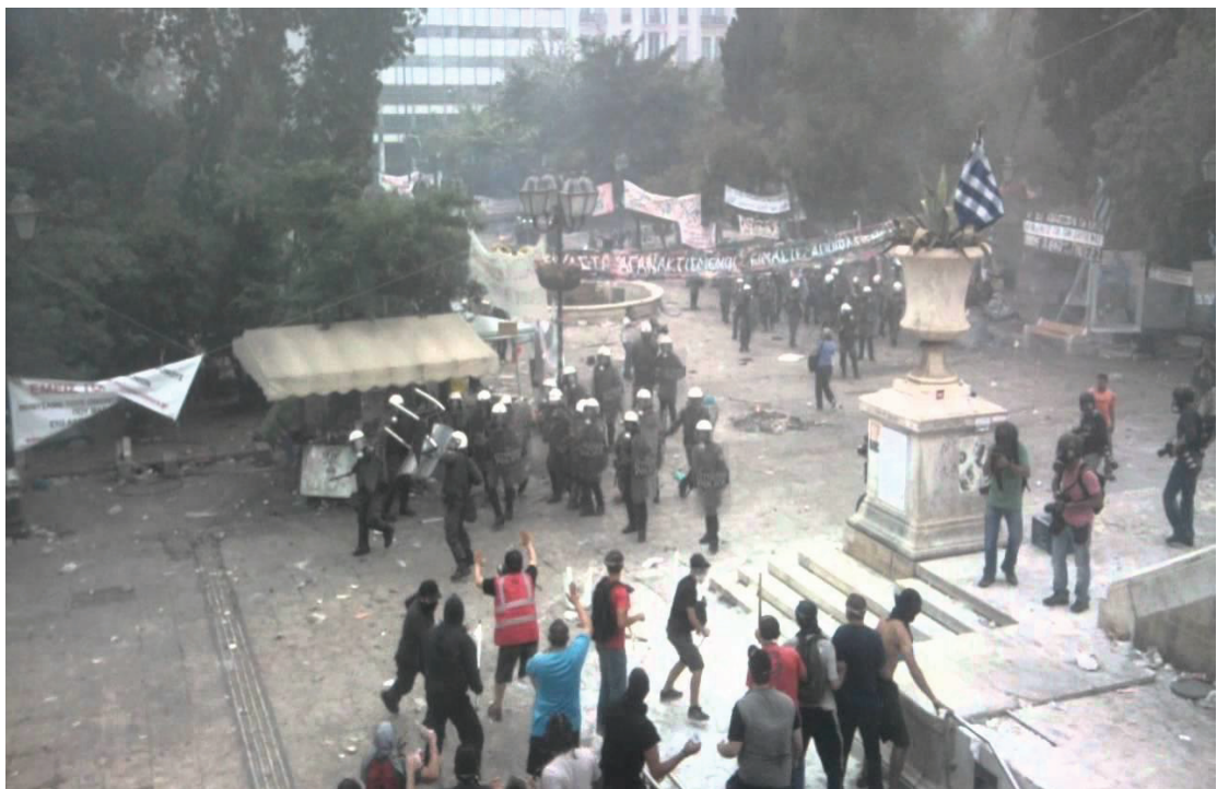
Εικόνα 16. Στιγμές βίας και ακαταστασίας έξω από την Βουλή