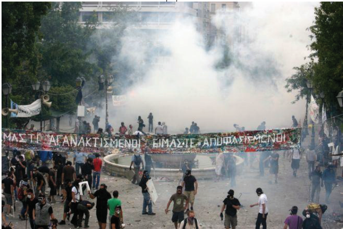
Εικόνα 18. Πανό με συνθήματα Αγανακτισμένων