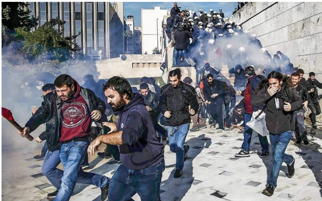
Εικόνα 10. Πρώτη φορά χημικά από τις αρχές προς τους διαδηλωτές κατά την διάρκεια θερμών επεισοδίων.