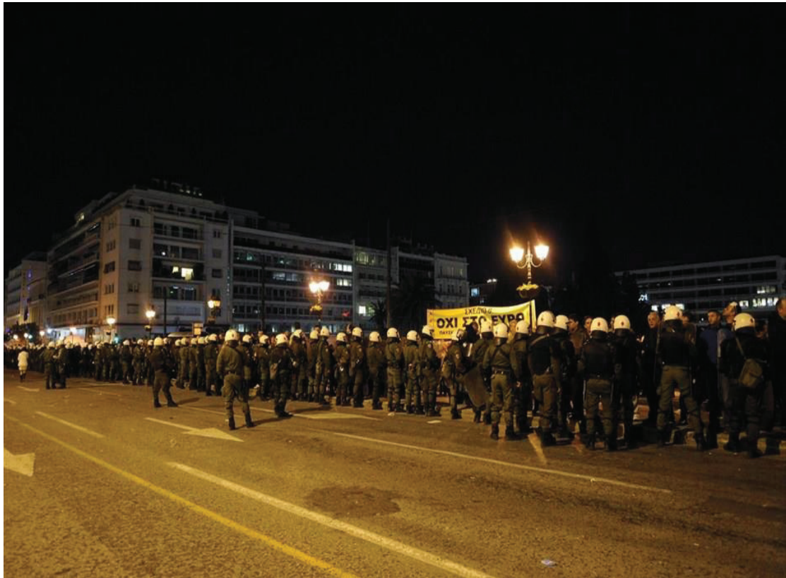
Εικόνα 15. Παρατεταγμένες δυνάμεις των αρχών