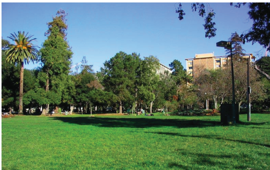
Εικόνα 3. Πάρκο του Λαού στο Μπέρκλεϋ

Στα τέλη της δεκαετίας του 1960 όπου ο ριζοσπαστισμός αναβλύζει σε κοινωνικά κινήματα, παίρνει χώρα και η δημιουργία του Πάρκου του Λαού στο Μπέρκλεϋ.