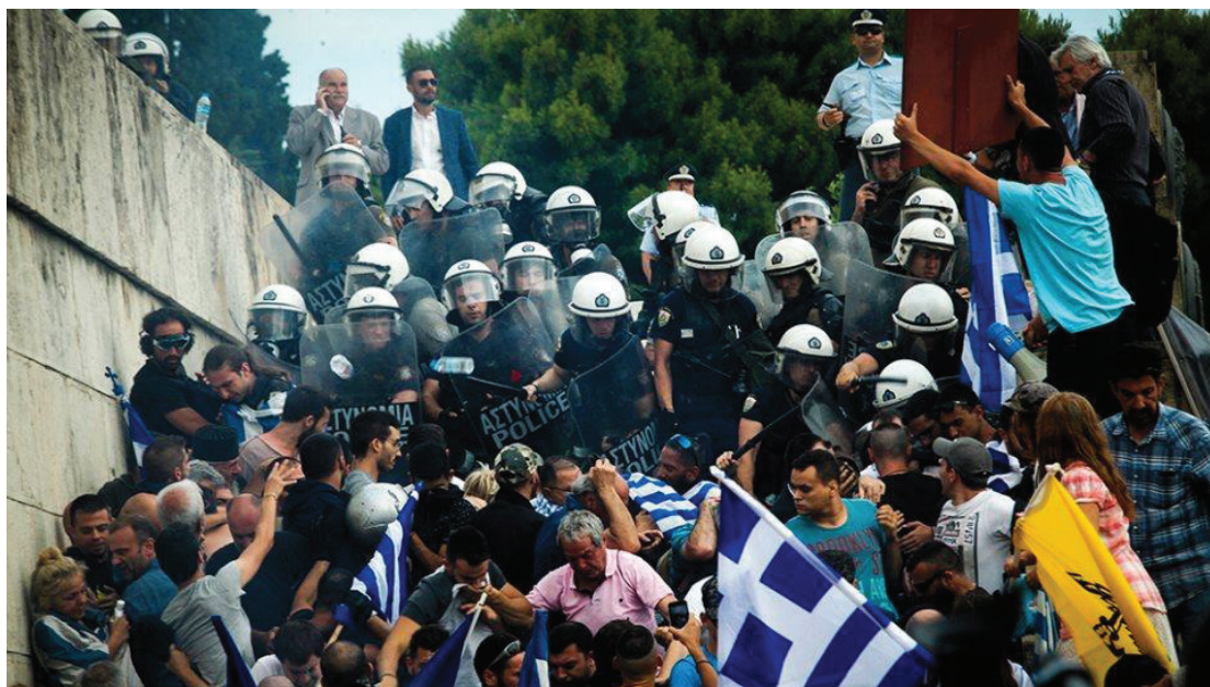
Εικόνα 11. Παρουσία επίλεκτης αστυνομικής δύναμης σε διαδήλωση των Αγανακτισμένων στην πλατεία Συντάγματος.

Το γεγονός ότι ο άνθρωπος δεν δέχεται έτσι απλά την εν γένει καταπόνηση αυτή στη «πλάτη» του είναι κάτι το θεμιτό για αρκετούς κοινωνιολόγους, φιλόσοφους αλλά και ειδικούς της ψυχικής υγείας αφού δημιουργούν τις προϋποθέσεις για φύλαξη των ανθρωπίνων δικαιωμάτων και αναγκαίων αγαθών όπως προαναφέρθηκε. Καθώς τα διάφορα κακώς κείμενα στα πολιτικά δρώμενα αναδύονται με δυσφορία ακόμη και από τα πολιτικά πρόσωπα, ο ενεργός πολίτης όντας εκ φύσεως διαμαρτυρόμενος στα εναντίον του «πυρά», δημιουργεί αυτές τις ενώσεις που όπως έχει αναλυθεί στη παρούσα μελέτη μεταφράζεται σε συνδικάτα, λόμπι, συνεταιρισμούς, ΜΚΟ ακόμα και παράνομες «συμμορίες» όπως οι οργανωμένοι κουκουλοφόροι αγνώστου ταυτότητας.