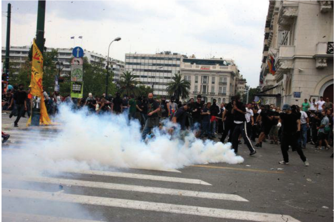
Εικόνα 17. Επεισόδια με δακρυγόνα