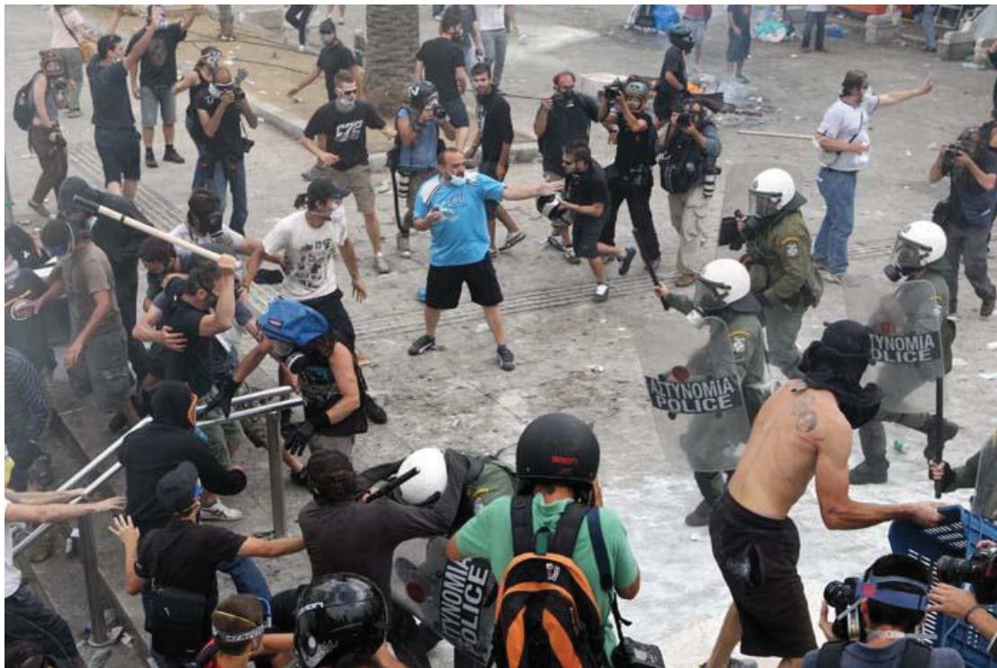
Εικόνα 14. Ένταση μεταξύ των ΜΑΤ και των διαδηλωτών