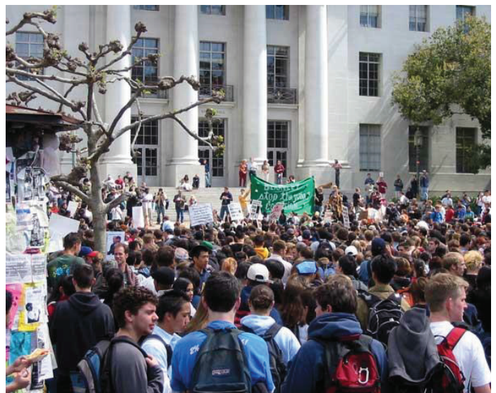
Εικόνα 7. Sproul Plaza Ράλι 20 Μαρτίου 2003: Διαμαρτυρία ειρηνική υπέρ του Ιράκ για να σταματήσει ο πόλεμος.