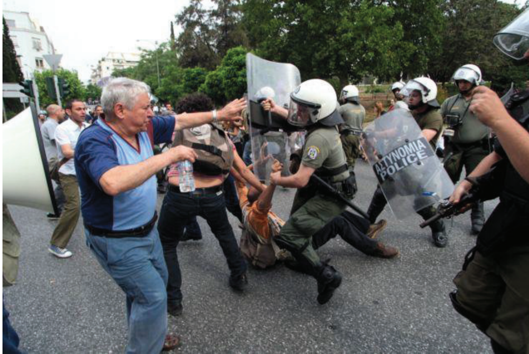
Εικόνα 13. Μάχη σώμα με σώμα διαδηλωτών με τις αρχές.