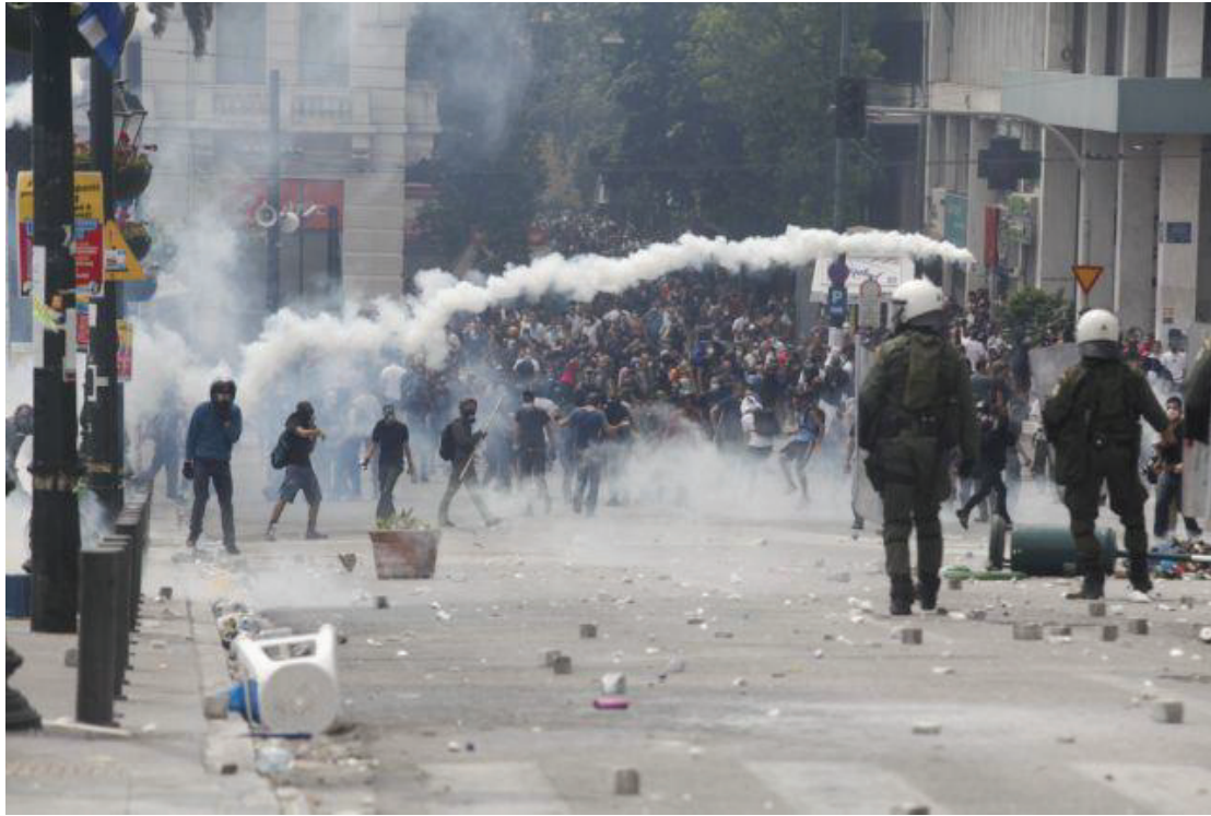
Εικόνα 19. Μάχη διαδηλωτών με τα MAT