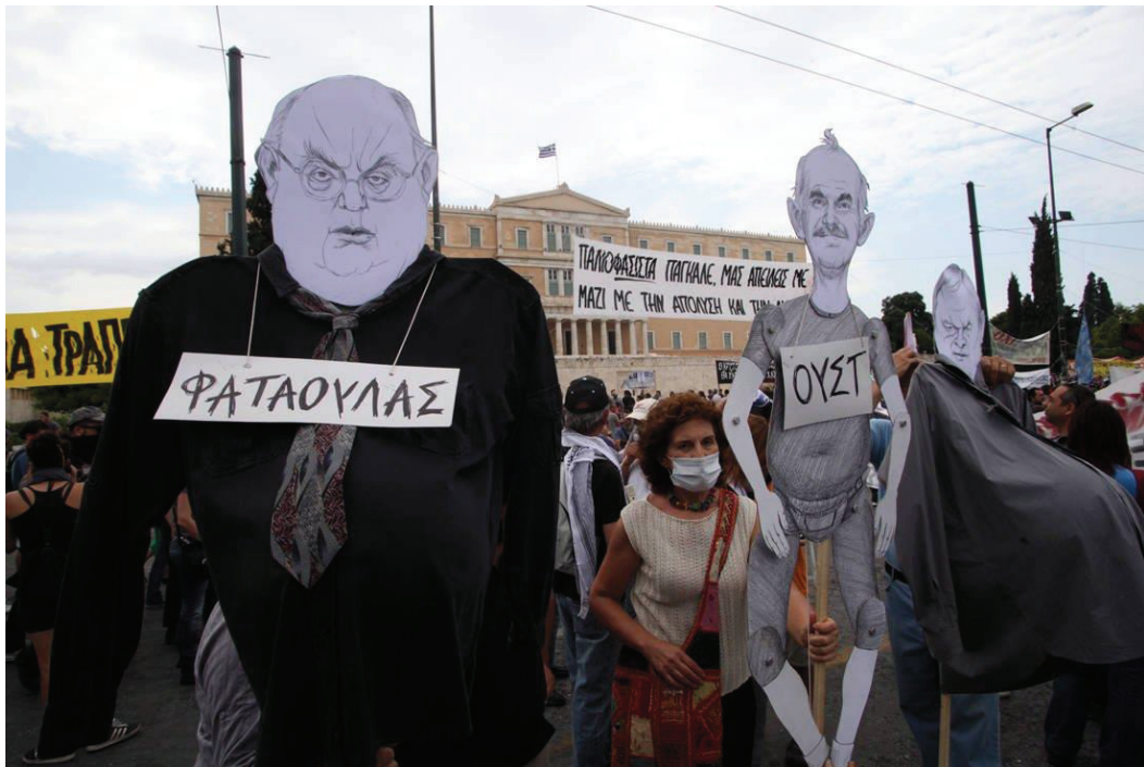
Εικόνα 9. Αντιπολιτική καμπάνια σε συγκέντρωση των Αγανακτισμένων.