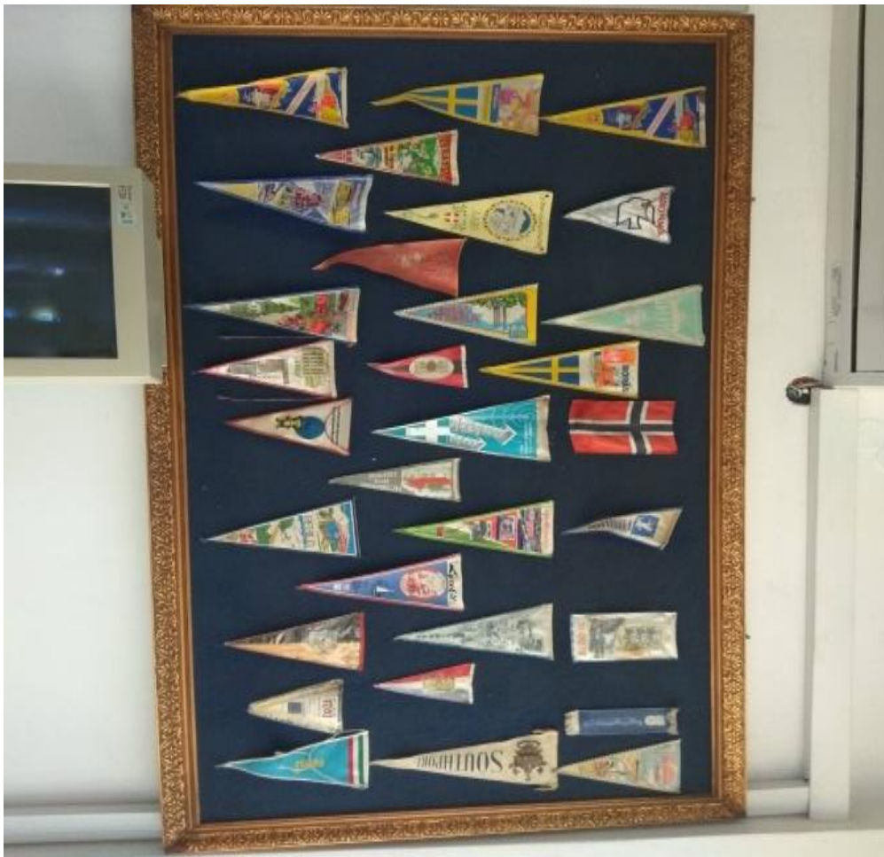
Εικόνα 2: Οι σημαίες από τις χώρες που λάμβαναν το σήμα της ΕΡΑ Πύργου

ραδιοφωνικό σταθμό. Ο ραδιοφωνικός σταθμός ΕΡΑ ιδρύθηκε ως ένας ιδιωτικός σταθμός. Το 1954 δημιουργήθηκε ένας σύλλογος ο οποίος αποτελούταν από 6 άτομα και στην συνέχεια το 1959 δημιούργησαν τον ραδιοφωνικό σταθμό ΕΡΑ. Όταν πρωτοξεκίνησε εξέπεμπε στα μεσαία κύματα. Η πρώτη τους κεραία τοποθετήθηκε στην Αγκινάρα στο Καταράχι όπου εκεί ήταν ήδη τοποθετημένη κεραία και ραδιοφωνικός σταθμός από τους Γερμανούς. Επέλεξαν το σημείο αυτό διότι το σήμα που εξέπεμπε ήταν άριστο και τα ραδιοκύματα ξεπερνούσαν τα όρια της Ελλάδας και έφταναν μέχρι και την Ευρώπη. Αυτό διαπιστώνεται και από το γεγονός ότι οι χώρες που λαμβάναν το σήμα αυτού του ραδιοφωνικού σταθμού τους έστελναν και από μία σημαία ως ένδειξη ότι τους ακούνε (εικόνα 2).