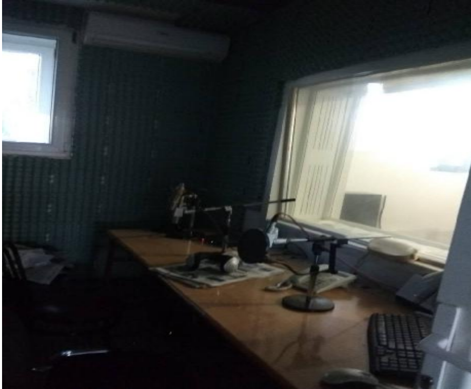
Εικόνα 3: Χώρος παραγωγού στο στούντιο της ΕΡΑ Πύργου