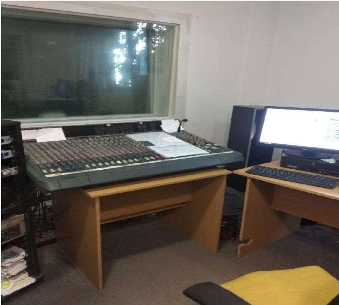
Εικόνα 4: Χώρος ηχολήπτη στο στούντιο της ΕΡΑ Πύργου