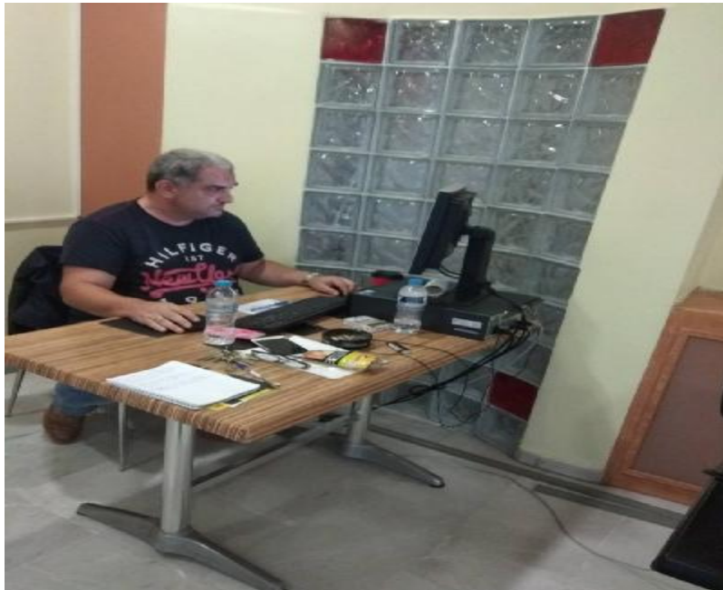
Εικόνα 5: Προθάλαμος ραδιοφωνικού σταθμού VOX 103,3