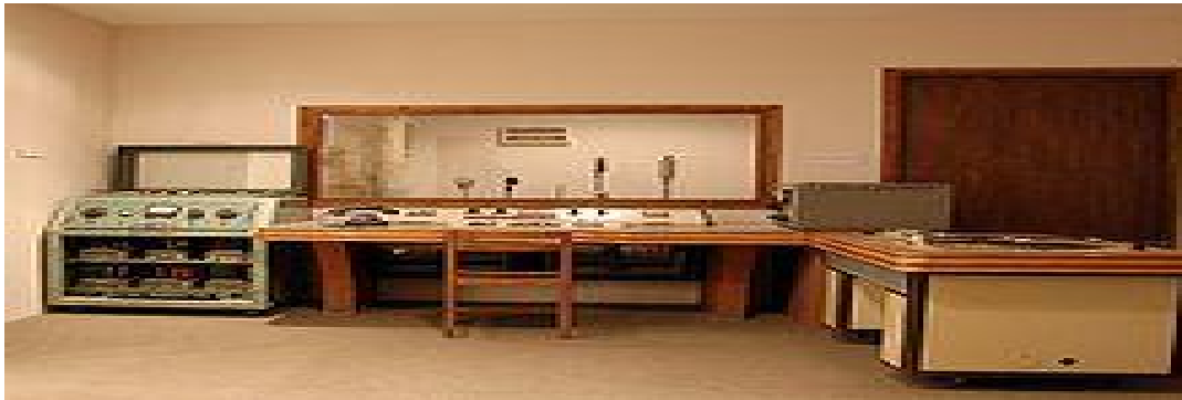
Εικόνα 1: Ραδιοφωνικό στούντιο (Μπαρμπούτης & Κλώντζας, 2001).

Οι κρατικές προσπάθειες για ίδρυση ραδιοφωνικού σταθμού, που άρχισαν άρχισαν το 1929, δεν είχαν όμως κάποιο αποτέλεσμα, επειδή υπήρχαν πολλά δικαστικά ζητήματα. Το διάστημα 1932 ή 1935-1938 εξέπεμπε, για παράδειγμα, στην περιοχή του Πειραιά ενώ παράλληλα, όμως, από το 1930 είχε αρχίσει να τίθεται το νομικό πλαίσιο για τη λειτουργία της ραδιοφωνίας. Το Καθεστώς της 4ης Αυγούστου κινήθηκε αρκετά ενεργά προς τη δημιουργία κρατικού ραδιοφωνικού σταθμού με βοήθεια της Ναζιστικής Γερμανία, η οποία είχε επενδύσει στο ραδιόφωνο σαν το μέσο της προπαγάνδας. Έτσι το 1936 υλοποιήθηκε η ιδέα της Υπηρεσίας Ραδιοφωνικών Εκπομπών. (Μπαρμπούτης & Κλώντζας, 2001)