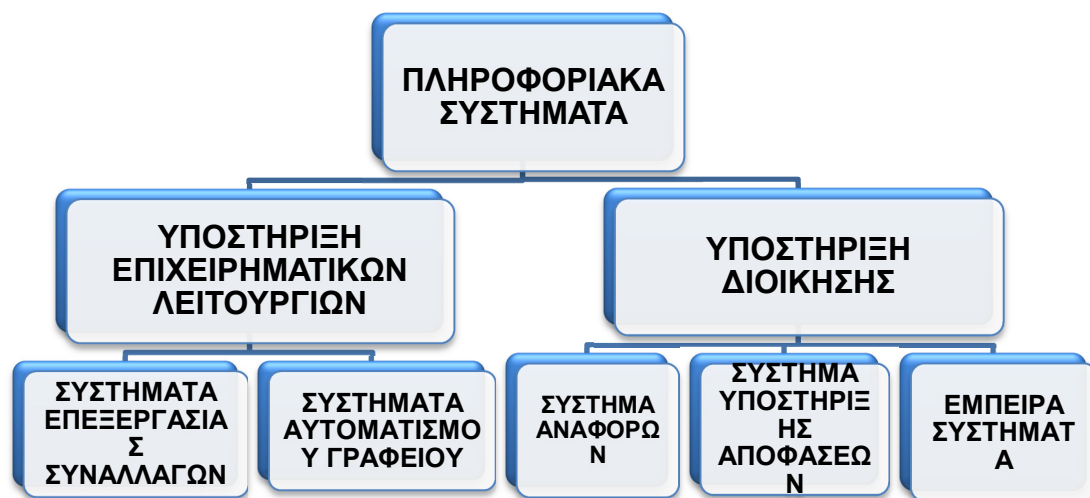
Εικόνα 1 Τύποι Π.Σ. Ανάλογα με το Είδος της Υποστήριξης που Παρέχουν