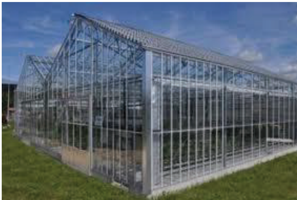
Εικόνα 2 Θερμοκήπιο αμφίρρικτο πολλαπλό

Λέμε το θερμοκήπιο που σχηματίζεται με την κατά μήκος και πλάτος επανάληψη της κατασκευαστικής μονάδας όπως φαίνεται στην πιο κάτω φωτογραφία.