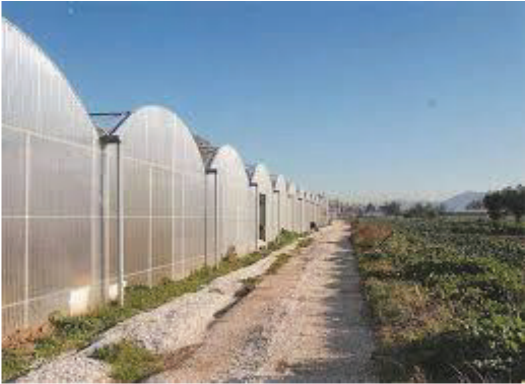
Εικόνα 5 Τροποποιημένο

Είναι εκείνο το θερμοκήπιο, που σχηματίζεται από την κατά μήκος και πλάτος επανάληψη της κατασκευαστικής τους μονάδας.