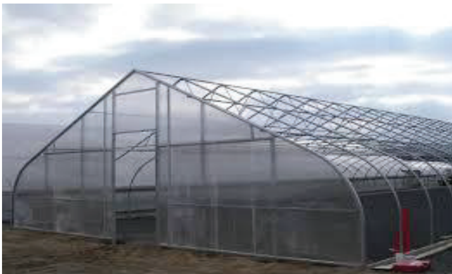
ΘΕΡΜΟΚΗΠΙΟ ΜΕ ΦΥΛΛΑ EVA

Αντίστοιχα υπάρχουν και μειονεκτήματα στο φύλλο EVA, όπως το μικρό διάστημα ζώης και είναι περατό στη μεγάλη μήκους κύματος ακτινοβολία, και αυτό σημαίνει ότι πέφτει η θερμοκρασία μέσα στο θερμοκήπιο, στη διάρκεια της νύχτας. Επιπροσθέτως αποτελεί μειονέκτημα, ότι μαζεύονται πολλές σταγόνες νερού, στην επιφάνεια του, οι οποίες πέφτουν στα φυτά.