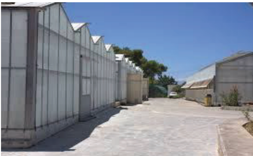
ΘΕΡΜΟΚΗΠΙΟ ΜΕ ΑΚΡΥΛΙΚΗ ΕΠΙΦΑΝΕΙΑ

Το υλικό της ακρυλικής επιφάνειας, είναι πολύ ανθεκτικό στη διάβρωση, με μεγάλη διαφάνεια. Το ποσοστό απορρόφησης υπέρυθρης ακτινοβολίας είναι σχεδόν το ίδιο με το γυαλί. Έχει επίσης την ίδια περατότητα στο φως με το γυαλί. Αυτό το υλικό διατηρεί ικανοποιητικά τη διαφάνεια του τουλάχιστον για 15 χρόνια πιο πολύ, από όλα τα άλλα πλαστικά που έχουν αναφερθεί μέχρι τώρα. Τα μειονεκτήματά του είναι η πολύ υψηλή τιμή του, και ότι είναι σχετικά εύφλεκτο.