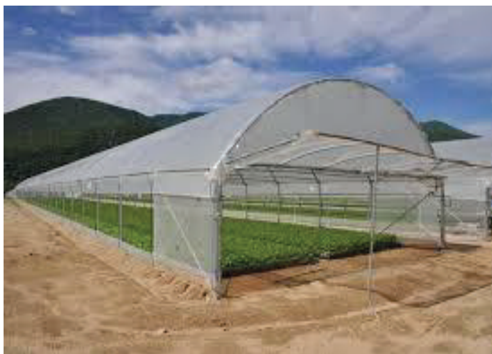
Εικόνα 4 Θερμοκήπιο τροποποιημένο τοξωτό

Το θερμοκήπιο που η απλή κατασκευαστική του μονάδα έχει το παρακάτω σχήμα (ορθοστάτες και τοξωτή στέγη).