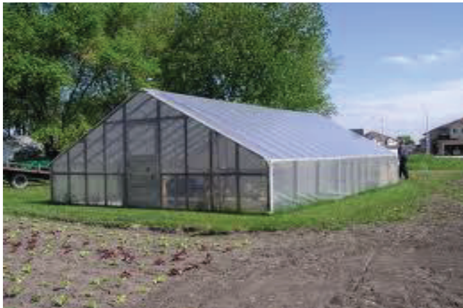
Εικόνα 1 Αμφίρρικτο

Ο τύπος αυτός έχει το σχήμα που φαίνεται στην πιο κάτω φωτογραφία.