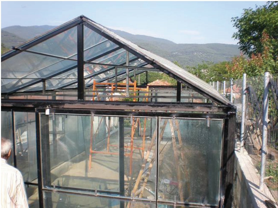
15 ΕΙΚΟΝΑ ΘΕΡΜΟΚΗΠΙΟ ΜΕ ΥΑΛΟΠΙΝΑΚΕΣ

Δεν παύει, όμως να έχει μειονεκτήματα, όπως ότι είναι εύθραυστο, είναι άκαμπτο, και έχει αρκετό βάρος. Χρειάζεται να είναι αρκετά ενισχυμένος και άκαμπτος ο σκελετός, αυτό όμως σημαίνει και μεγαλύτερο κόστος. 14