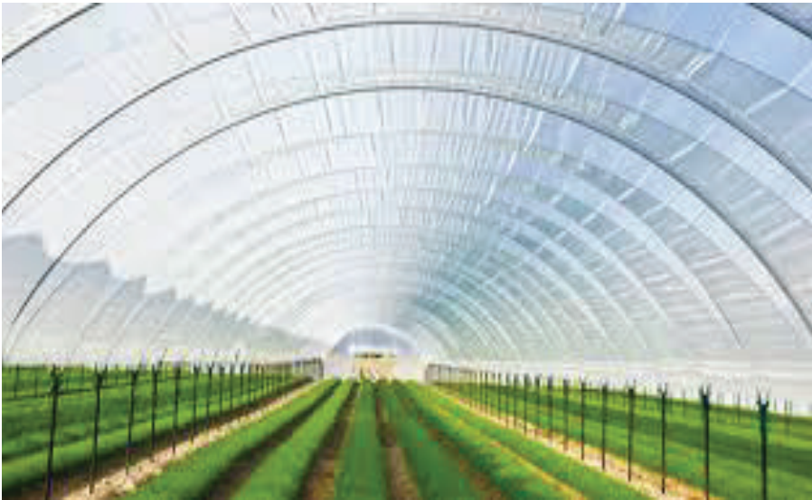
φύλλο Πολυβινυλοχλωριδίου (PVC)

Το φύλλο πολυβινυλοχλωρίδιο έχει μικρή περατότητα στη μεγάλη μήκους κύματος ακτινοβολία. Είναι αναγκαίο, να έχει ενσωματωμένο απορροφητή της υπεριώδους ακτινοβολίας. Είναι ακριβότερο από το πολυαιθυλένιο και συνήθως, συσσωρεύεται σκόνη στην επιφάνεια του. Πρέπει να πλένεται το χειμώνα για να διατηρείται η φωτεινότητα του θερμοκηπίου. 18