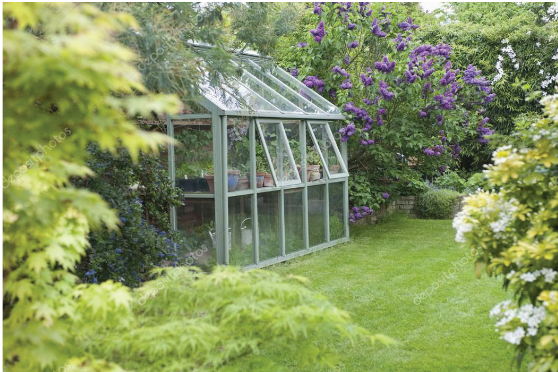
ΘΕΡΜΟΚΗΠΙΟ ΜΕ ΤΖΑΜΙ

Το ελάχιστο πάχος του τζαμιού θα πρέπει να είναι 4 mm. Οι διαστάσεις των τεμαχίων του τζαμιού θα πρέπει να ακολουθούν την παρακάτω αριθμητική σχέση 1,8 \leq \text{μήκος} / \text{πλάτος} \leq 3 .