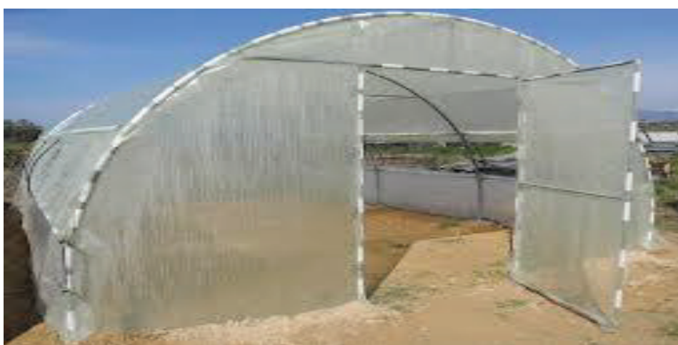
Εικόνα 3 Θερμοκήπιο τοξωτό

Το θερμοκήπιο που η απλή κατασκευαστική του μονάδα καθορίζεται από δύο συνεχόμενα τόξα όπως φαίνεται στη φωτογραφία.