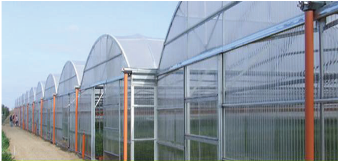
Vista frontale serre con tamponatura frontale in policarbonato ondulato trasparente