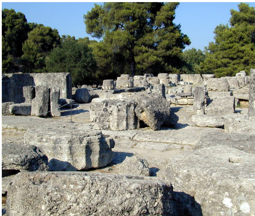
Ναός του Δία

Αποτελούσε το σημαντικότερο οικοδόμημα της Άλτεως στην Ολυμπία και δέσποζε στο κέντρο της. Είναι ο μεγαλύτερος ναός της Πελοποννήσου, ένα από τα μεγαλύτερα μνημεία σε πλούτο, μέγεθος και συμβολική αξία.