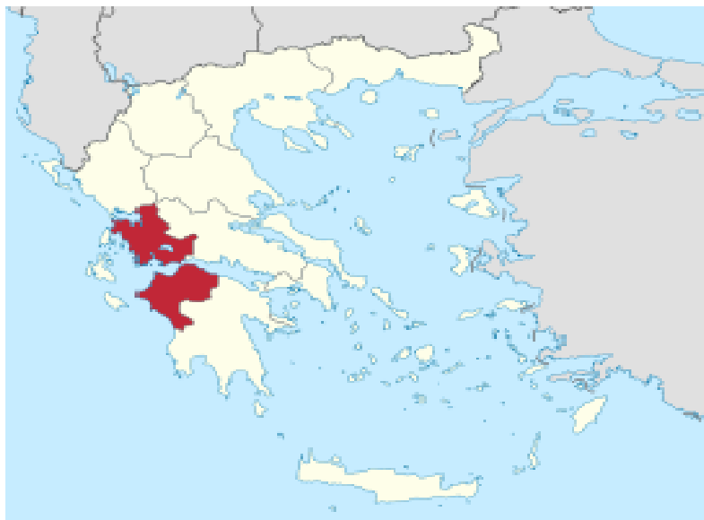
Περιφέρεια Δυτικής Ελλάδας

Μια από τις 13 περιφέρειες της Ελλάδας είναι η περιφέρεια Δυτικής Ελλάδας και εκτείνεται στο βορειοδυτικό τμήμα της Πελοποννήσου και στο δυτικό της Στερεάς Ελλάδας. Καταλαμβάνει έκταση 15.490 τετραγωνικά χιλιόμετρα κι έχει πληθυσμό περίπου 680.190 όπως προέκυψε από την απογραφή του 2011 σύμφωνα με την Ελληνική Στατιστική Υπηρεσία. Η μεγαλύτερη πόλη και ταυτόχρονα η πρωτεύουσά της περιφέρειας Δυτικής Ελλάδας είναι η Πάτρα. ( http://el.wikipedia.org/wiki/%CE%91%CF%81%CF%87%CE%B5%CE%AF%CE%BF:Dytiki_Ellada_in_Greece.svg )