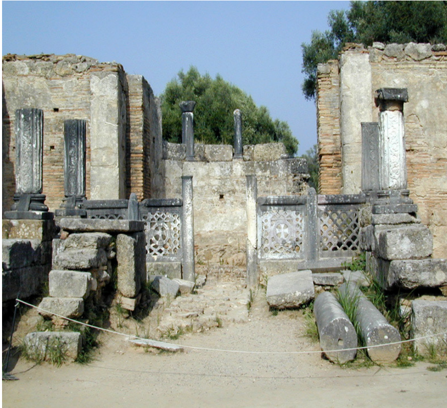
Εργαστήριο του Φειδία

Άλλα μνημεία στο χώρο της Αρχαίας Ολυμπίας είναι: