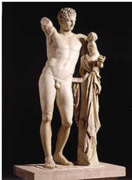
Ερμής του Πραξιτέλη

Την εποπτεία του Αρχαιολογικού Μουσείου της Ολυμπίας έχει η Ζ΄ Εφορεία Προϊστορικών και Κλασικών Αρχαιοτήτων . Αναμφίβολα, αποτελεί ένα ζωντανό οργανισμό που μετά την αναμόρφωσή του το 2004, με τους Ολυμπιακούς Αγώνες της Αθήνας, επιδιώκει την παρουσίαση της μακραίωνης ιστορίας του ιερού στον επισκέπτη με βάση τις νέες μουσειολογικές αντιλήψεις. ( http://odysseus.culture.gr/h/1/gh151.jsp?obj_id=7126 )