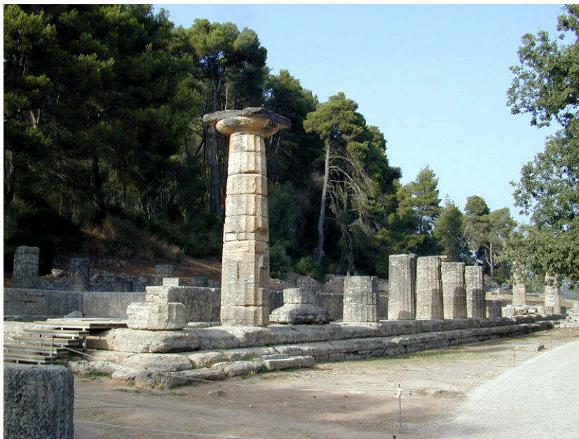
Ναός της Ήρας

Πρόκειται για εθνικό κληροδότημα μεγάλης ιστορικής σημασίας και η προστασία του χώρου αποτελεί μέλημα του κράτους. Ιστορικά η παλαιότερη ένδειξη ανθρώπινης παρουσίας στην περιοχή χρονολογείται στην τρίτη χιλιετία π.Χ. Τον 9ο αιώνα π.Χ. η Αρχαία Ολυμπία ήταν ένας ιερός τόπος που προσέλκυε πολλούς προσκυνητές. Τον 8ο αιώνα η φήμη της μεγάλωσε τόσο και έφτασε σε χώρες της Ανατολής και της Δύσης. Καθοριστική χρονιά στην ιστορία της στάθηκε το έτος 776 π.Χ. που ο Σπαρτιάτης Λυκούργος πραγματοποίησε συμφωνία με τον βασιλιά της Ήλιδος Ίφιτο για την τέλεση λατρευτικών εορτών εκεί. Κομμάτι της συμφωνίας αποτέλεσε το γεγονός ότι κατά τις γιορτές θα επικρατούσε εκεχειρία σε ολόκληρη τη χώρα.