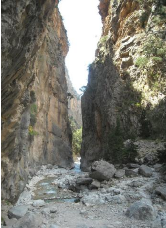
Εικόνα. Φαράγγι Σαμαριάς