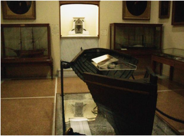
Εικόνα 7: Άποψη αίθουσας του εκθεσιακού χώρου

και η συνολική πληροφορία των αντικειμένων σε μία έκθεση θα καθίστανται προσβάσιμες στον επισκέπτη, διατηρώντας μια ισορροπία στην οποία η μοναδικότητα ενός αντικειμένου δεν θα απορροφάται από το συνολικό νόημα μια ενότητας, αλλά και ότι σε περιπτώσεις όπου η εμφατικότητα σε ένα συγκεκριμένο αντικείμενο κρίνεται αναγκαία, αυτό δεν θα λειτουργεί απονοηματοδοτώντας την ενότητα ή στη χειρότερη την έκθεση.