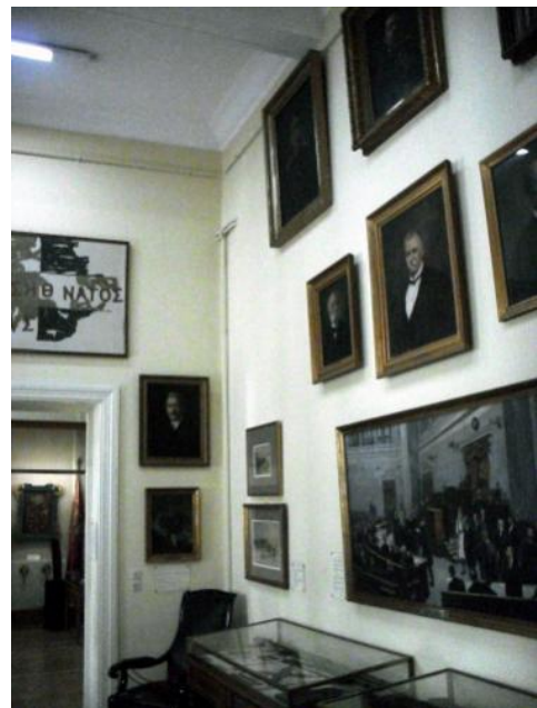
Εικόνα 8: Άποψη αίθουσας του εκθεσιακού χώρου

Κατά τη γνώμη μου, το αντικείμενο σε μια έκθεση δεν ολοκληρώνεται νοηματικά μέσα από την μοναδικότητά του, αλλά νοηματοδοτείται μέσα από μια σύνθεση στοιχείων όπως, η σχέση του με το χώρο που το περιβάλλει και το πώς δένει με αυτόν, αλλά και από το γεγονός ότι είναι τμήμα ενός συνόλου αντικειμένων που συνθέτουν μια ενότητα. Η χωροταξική διάταξη των εκθεμάτων συν τοις άλλοις, όταν είναι προϊόν μελετημένου σχεδιασμού, διασφαλίζει μαζί με άλλους παράγοντες, πως τόσο η μοναδική, όσο