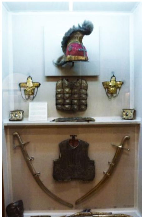
Εικόνα 4: προθήκη Θ. Κολοκοτρώνη

τους χαρακτηριστικά (τεχνοτροπία, καλλιτέχνης κ. τ. λ.), η επιλογή όμως του τρόπου έκθεσης και τοποθέτησής τους στο χώρο και στις προθήκες, σε συνδυασμό με την συνοδευόμενη πληροφορία, δεν είναι ένα γεγονός που επαφίεται στην τύχη ή σε μια υποκειμενική αντίληψη