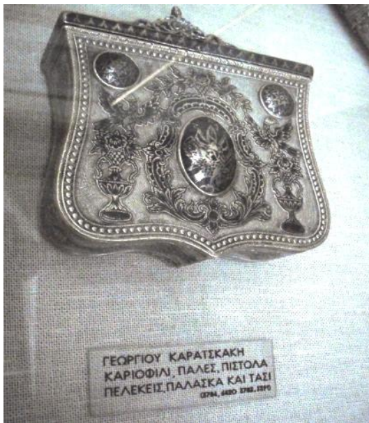
Εικόνα 2: άποψη λεζάντας αντικειμένου

Πραγματοποιώντας μια διαδρομή στην έκθεση της μόνιμης συλλογής του μουσείου, θα αντιληφθεί κανείς σχετικά σύντομα (αλλά και όπως θα δούμε παρακάτω) ένα επαναλαμβανόμενο εκθεσιακό μοτίβο, το οποίο διαπερνά όλες τις εκθεσιακές θεματικές ενότητες και κυρίως αυτές που αφορούν την νεώτερη ελληνική ιστορία, από την άλωση της