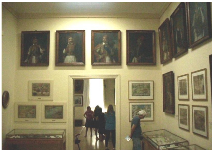
Εικόνα 3: ο επισκέπτης στο χώρο

Ένα συχνό φαινόμενο που θα παρατηρήσει κανείς σχεδόν στην πλειονότητα των ενοτήτων της έκθεσης, είναι το ιδιαίτερο ύψος στο οποίο τοποθετούνται τα πορτραίτα των προσωπικοτήτων της περιόδου σε σχέση όχι μόνο με τα υπόλοιπα εκθέματα, αλλά και με το ίδιο το οπτικό πεδίο του επισκέπτη (εικ.3). Το γεγονός αυτό με μια πρώτη ματιά ή καλύτερα με τη ματιά του μέσου επισκέπτη, ίσως μοιάζει «αθώο», αδιάφορο, σχετικά δυσλειτουργικό. Παρ' όλα αυτά το κλειδί για την ερμηνεία του συγκεκριμένου φαινομένου αλλά και άλλων που θα αναφερθούν στη συνέχεια, κατά τη γνώμη μου, βρίσκεται τόσο στη αντίληψη που διαμόρφωσε την έννοια του έθνους στην Ελλάδα (βλέπε παραπάνω κεφάλαια), όσο και στις ρίζες του Εθνικού Ιστορικού Μουσείου, που είναι η συλλογή της Ι. Ε. Ε. και η λογική που τη διαμόρφωσε, αλλά κυρίως στο πως προσεγγίζεται το αντικείμενο μέσα στο μουσείο.