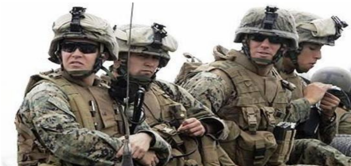
Εικόνα 12: Στρατιωτικές δυνάμεις στο πλευρό της Συρίας

Σύμφωνα με τις πηγές αυτές, τουλάχιστον 6.113 μαχητές έχουν σκοτωθεί στις μάχες με τις κυβερνητικές δυνάμεις μέχρι τώρα, ενώ δεν αποκλείεται ο αριθμός αυτός να είναι πολύ μεγαλύτερος.