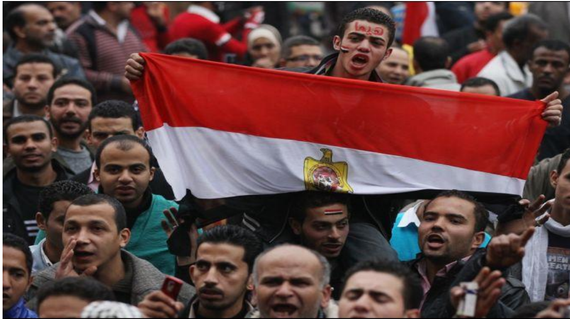
Εικόνα 16: Διαδηλωτές στους δρόμους της Αιγύπτου εναντιώνονται στο κόμμα του Μουμπάρακ