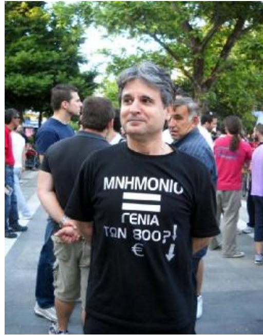
Εικόνα 22: Οι πολίτες συνεχίζουν να διαμαρτύρονται για το Μνημόνιο

Μετά την ψήφιση του 1ου μνημονίου και ενώ οι περισσότεροι θεωρούν ότι το κίνημα θα «ξεφουσκώσει», οι πλατείες συνεχίζουν, προς έκπληξη όλων, να γεμίζουν ασφυκτικά από πολίτες, κάθε μέρα και περισσότερους. Οι ανακοινώσεις σε διάφορα διαδικτυακά μέσα συνεχίζονται με μηνύματα «ο κόσμος ζύπνησε πάρτε το χαμπάρι», ενώ μετά τα επεισόδια που σημειώθηκαν στην πλατεία από άτομα που είχαν ενσωματωθεί μέσα στο πλήθος των αγανακτισμένων, προκαλώντας την οργή του πλήθους, κοινοποιήθηκε το εξής μήνυμα: «Όλοι πίστευαν πως κάτι θα αλλάξει, οι γνωστοί όμως βαλτοί του