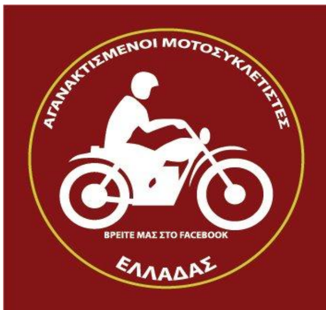
Εικόνα 24: Παράλληλα με τους «Αγανακτισμένους της πλατείας» αρχίζουν να κάνουν την εμφάνιση τους και άλλα κινήματα

μοτοπορεία, ενάντια στα αντιλαϊκά νομοσχέδια της κυβέρνησης. Η πορεία πραγματοποιήθηκε για λίγες μέρες σε Αθήνα, Θεσσαλονίκη και Λάρισα, ενώ σε ανακοινώσεις στην σελίδα της ομάδας, ενημέρωναν τους πολίτες για τη διαδρομή που θα ακολουθούσαν κάθε φορά, καθώς επίσης και για τα μέτρα