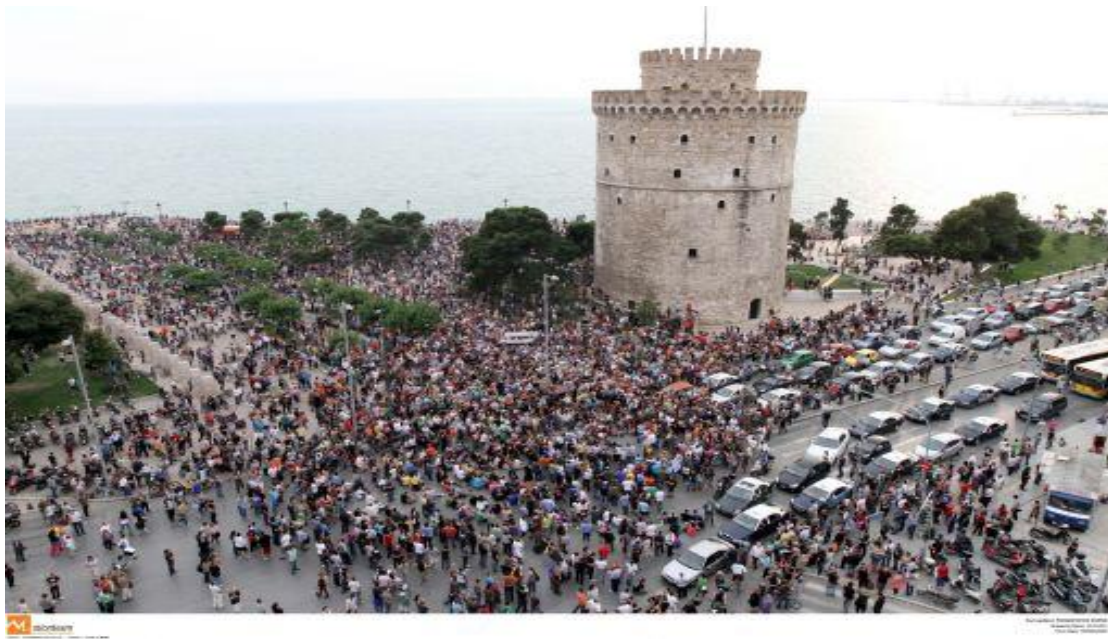
Εικόνα 23: Οι ειρηνικές διαδηλώσεις σε πλατείες μεγάλων πόλεων προκαλούν το ενδιαφέρον των ξένων δημοσιογράφων

μέσω αυτής της σελίδας δημιούργησα το γκρουπ για την εκδήλωση, η οποία τελικά όπως όλοι είδαμε έλαβε τεράστιες διαστάσεις. Ότι έκανα το έκανα χωρίς καμία σκοπιμότητα και χωρίς κανένα συμφέρον. Η αλήθεια είναι πως δεν περίμενα ότι θα είχε τέτοια απήχηση. Θέλησα απλά να μεταλαμπαδεύσω και στην Αθήνα το κίνημα που δημιουργούταν στη Θεσσαλονίκη. Άλλωστε, πιστεύω πως δεν είμαι μόνο εγώ αγανακτισμένος, αλλά η πλειονότητα των Ελλήνων». 77 Οι διαδηλώσεις των Αγανακτισμένων, από τον Μάιο έως και τον Νοέμβριο του 2011, σε δεκάδες πόλεις της Ελλάδας, δημιούργησαν νέα κινήματα αγανακτισμένων, (τα οποία όμως δεν κατάφεραν να αντέξουν), όπως τους Αγανακτισμένους Μοτοσικλετιστές, τους Αγανακτισμένους Ανέργους και όχι μόνο.