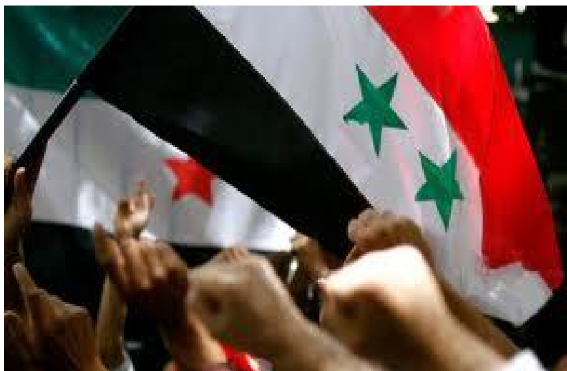
Εικόνα 10: Πλήθος κόσμου έδωσε το παρόν στη διαδήλωση της Συρίας

Σύμφωνα με τα στοιχεία που υπάρχουν, περίπου 11.000 άνθρωποι σκοτώθηκαν, οι οποίοι στο μεγαλύτερο μέρος τους ήταν διαδηλωτές, και περίπου 3.500 αποτελούσαν ένοπλους μαχητές. 22