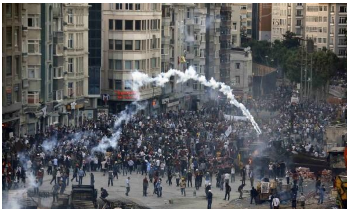
Εικόνα 17: Συμπλοκές διαδηλωτών – αστυνομικών με χρήση χημικών ουσιών στην Αίγυπτο

Κατά την προετοιμασία της συγκέντρωσης, η οποία πραγματοποιήθηκε με τη συμπλήρωση της πρώτης επετείου από την ανάληψη των καθηκόντων του κ. Μόρσι, οι διαδηλωτές έστησαν σκηνές, πανό με συνθήματα κατά του προέδρου στην πλατεία - σύμβολο της εξέγερσης η οποία ανέτρεψε το καθεστώς του Χόσνι Μουμπάρακ το 2011, ενώ άλλοι αντικυβερνητικοί διαδηλωτές κατευθύνθηκαν προς το Προεδρικό Μέγαρο.