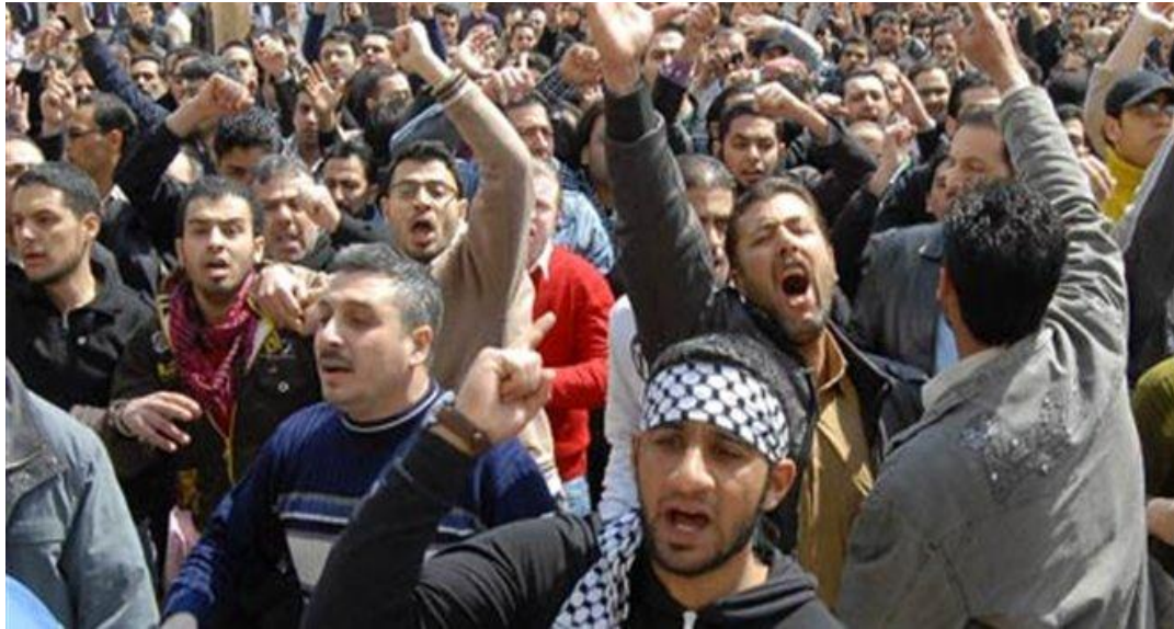
Εικόνα 11: Διαδηλωτές στη Συρία

Σε ανακοίνωση του συριακού στρατού αναφέρεται ότι «καταστράφηκε ισραηλινό όχημα με ό,τι είχε μέσα», δίχως να παρέχονται περαιτέρω λεπτομέρειες. Ο συριακός πρόεδρος Μπασάρ αλ-Άσαντ έχει κατηγορήσει επανειλημμένως το Ισραήλ ότι στηρίζει τους αντάρτες που μάχονται το καθεστώς του.