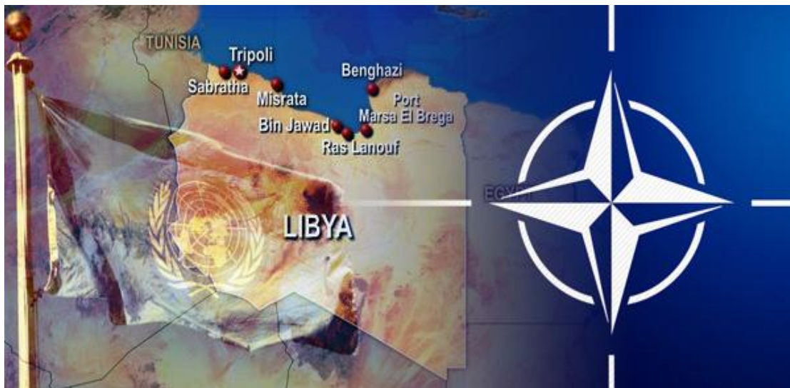
Εικόνα 15: Χάρτης επεμβάσεων Λιβύης

Η Γαλλία είχε δηλώσει ότι, μαζί με την Αγγλία, θα έστειλε αεροπλάνα για «συμβολική» πτήση πάνω από τη Λιβύη λίγο πριν την έναρξη της συνόδου. Παράλληλα, ο Αμερικανός Πρόεδρος Μπαράκ Ομπάμα, είχε δηλώσει ότι η χώρα του δεν θα συμμετέχει στις στρατιωτικές επιχειρήσεις, αλλά προειδοποίησε τον Καντάφι, ότι «σε περίπτωση που δεν τηρήσει την απόφαση του Συμβουλίου Ασφαλείας των Ηνωμένων Εθνών, οι ΗΠΑ (χωρίς τη χρήση χερσαίων δυνάμεων) θα δράσουν ως μέλος ενός συνασπισμού, με κύριο στόχο την ασφάλεια των πολιτών». Η Γερμανία από την μεριά της είχε υποστηρίξει ότι μια στρατιωτική επέμβαση στη Λιβύη επιφυλάσσει πολλούς κινδύνους και προτρέπει τις άλλες χώρες να μην το κάνουν. Η Ελλάδα είχε δηλώσει ότι θα συμμετέχει στις στρατιωτικές επιχειρήσεις στη Λιβύη, με μοναδικό όρο την ομόφωνη απόφαση. 34