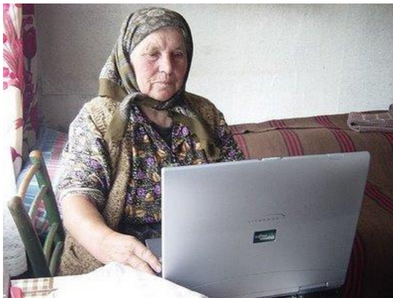
Εικόνα 3: Η εξέλιξη των νέων τεχνολογιών τον 21ο αιώνα

Γενικά με τον όρο ψηφιακό χάσμα εννοείται και το κενό που παράγεται ανάμεσα σε άτομα ή και ομάδες που ωφελούνται από τις νέες τεχνολογίες και σε εκείνα που δεν ωφελούνται. Το ΨΧ ως όρος περιγράφει εν μέρει ανισότητες σχετικές με την