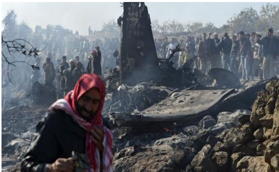
Εικόνα 9: Οι καταστροφικές συνέπειες του «Συριακού εμφύλιου πολέμου»

Μετά από την εξέγερση των πολιτών, η κυβέρνηση αποφάσισε να στείλει το συριακό στρατό, προκειμένου να καταφέρει την καταστολή των επεισοδίων, ενώ κατά την διάρκειά του πολλές πόλεις πολιορκήθηκαν.