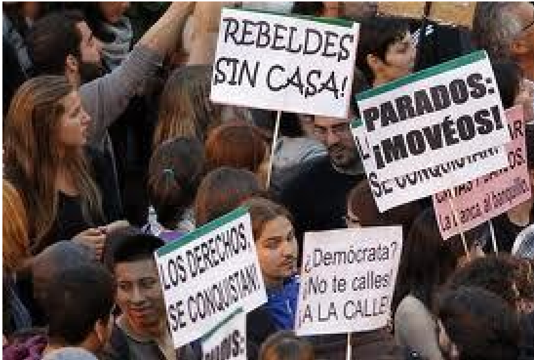
Εικόνα 26: Στο πλευρό της Ελλάδα πολλές χώρες της ΕΕ

Την ίδια στιγμή, όπως ανέφερε, η ανακοίνωση που ανέβηκε στον ιστότοπο madrid.tomalaplaza.net , σκοπός της συνάντησης είναι να «ενισχυθεί και να εξαπλωθεί το κίνημα».