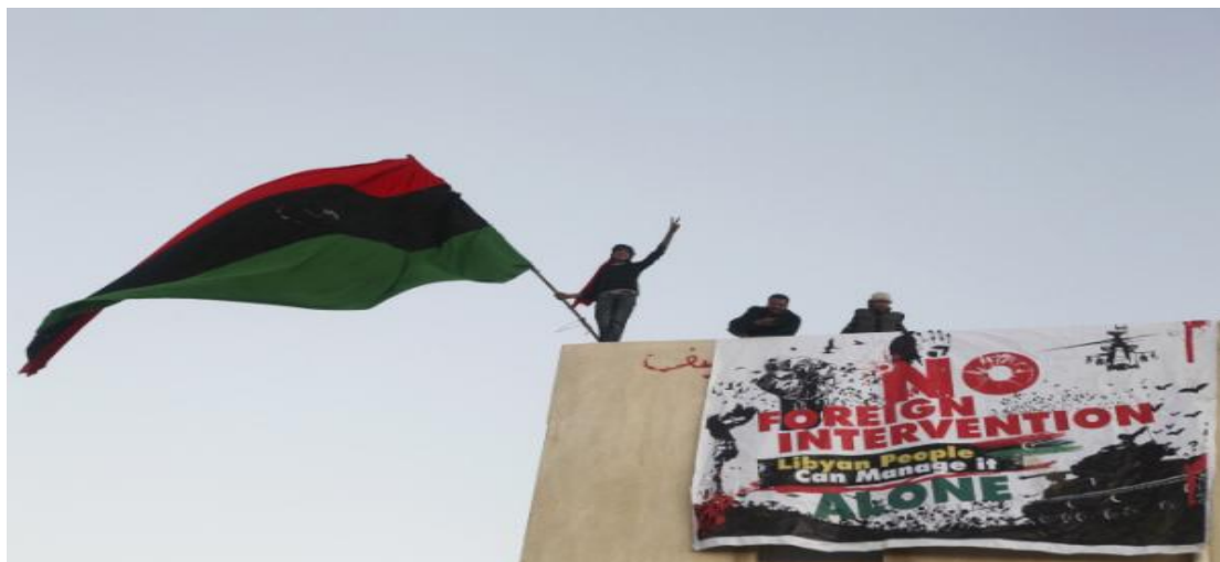
Εικόνα 14: Διαδηλωτές αναρτούν πανό σε κεντρική σημείο της Λιβύης

στην Άγκυρα. Ο Σαρκοζί επίσης δήλωσε ότι «δεν αποκλείεται στρατιωτική παρέμβαση για την μετακίνηση του Καντάφι από την εξουσία». 28