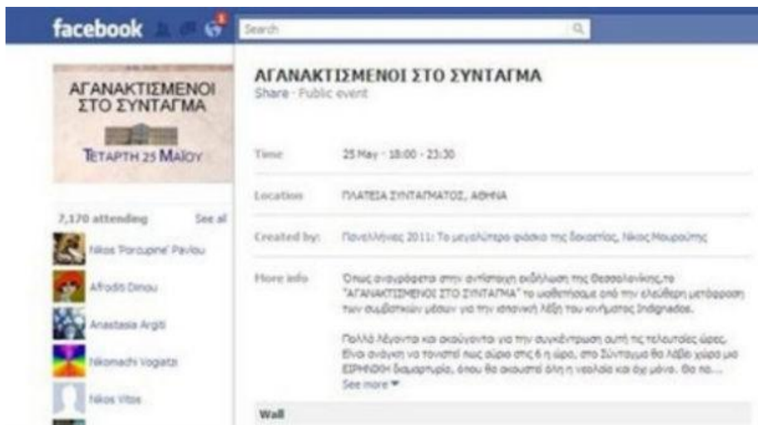
Εικόνα 21: Η ομάδα των «αγανακτισμένων» στο διαδίκτυο

Στο διαδίκτυο οι σκέψεις, οι ιδέες, οι προβληματισμοί μεταφέρονται και εξαπλώνονται όπως το ηλεκτρικό ρεύμα μέσα από τα καλώδια. Σε ελάχιστο χρόνο δημιουργήθηκε η σελίδα Αγανακτισμένοι στο Σύνταγμα και πολύ γρήγορα σελίδες Αγανακτισμένων σε κάθε ελληνική πόλη -και σε πολλές περισσότερες από μία.