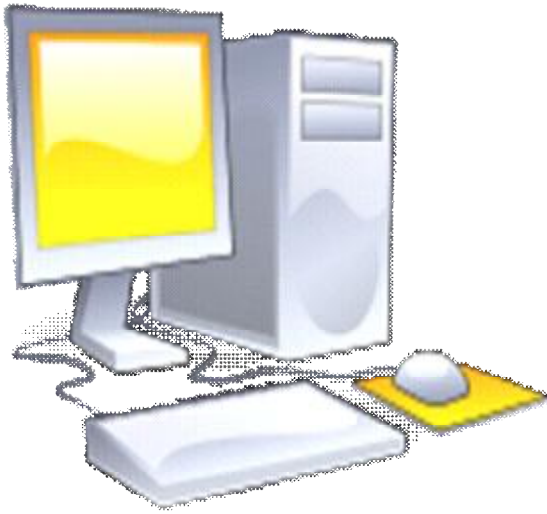
Εικόνα 2: Οι Η/Υ έχουν ενταχθεί στην καθημερινότητα των πολιτών

Η κυριότερη αιτία που περιορίζει την εξάπλωση του κυβερνοχώρου είναι το οικονομικό ζήτημα.