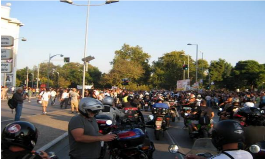
Εικόνα 25: Οι «Αγανακτισμένοι μοτοσικλετιστές» δίνουν το παρόν σε όλη την Ελλάδα