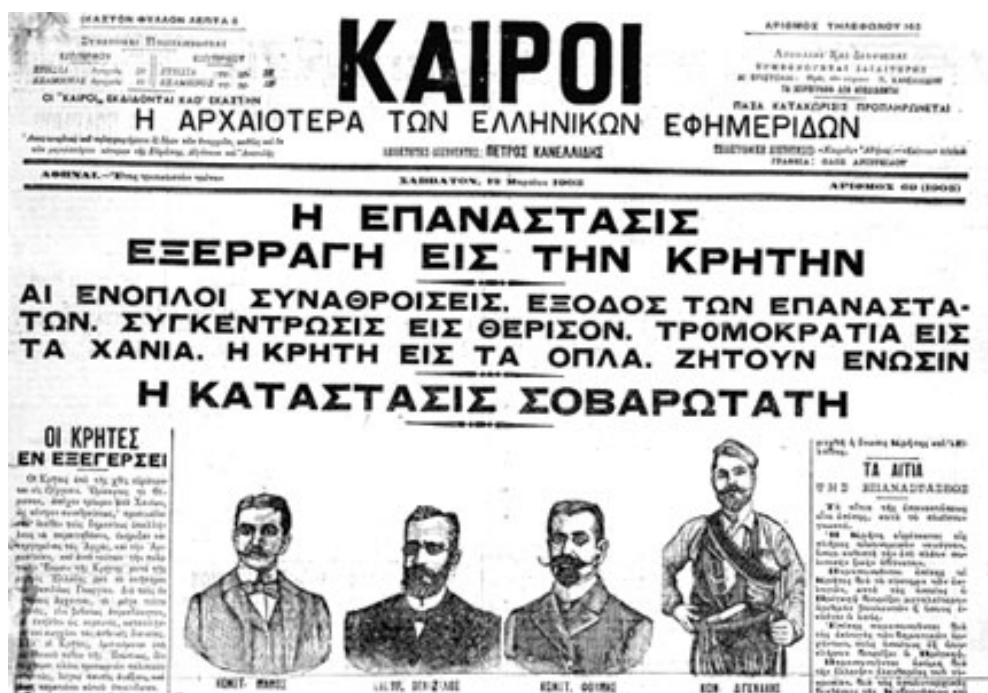
Εικόνα 7: Πρωτοσέλιδο εφημερίδας «Καιροί» που αναφέρεται στην επανάσταση του Θερίσου

Μετά από τις πρώτες 50 ημέρες, άρχισαν οι εχθροπραξίες μεταξύ των καθεστωτικών και των ανταρτών. Η κορύφωση του κρητικού δράματος θα μπορούσε να είχε αποφευχθεί, ιδίως αν είχε υιοθετηθεί παρόμοιο μεσολαβητικό σχέδιο από τον Γενικό Πρόξενο της Μεγάλης Βρετανίας ήδη από τα μέσα Ιουνίου.