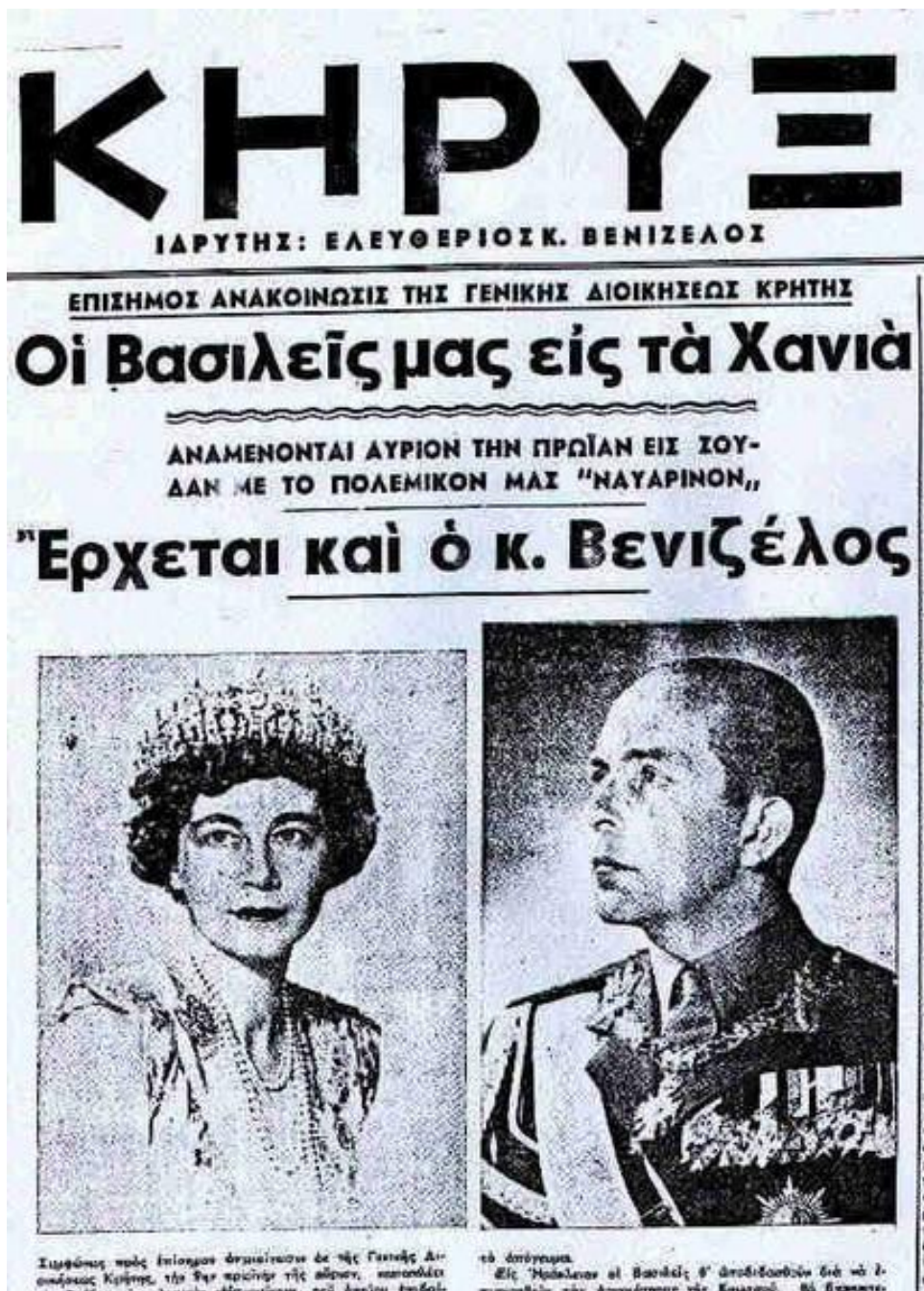
Εικόνα 8: Πρωτοσέλιδο της εφημερίδας «ΚΗΡΥΞ»