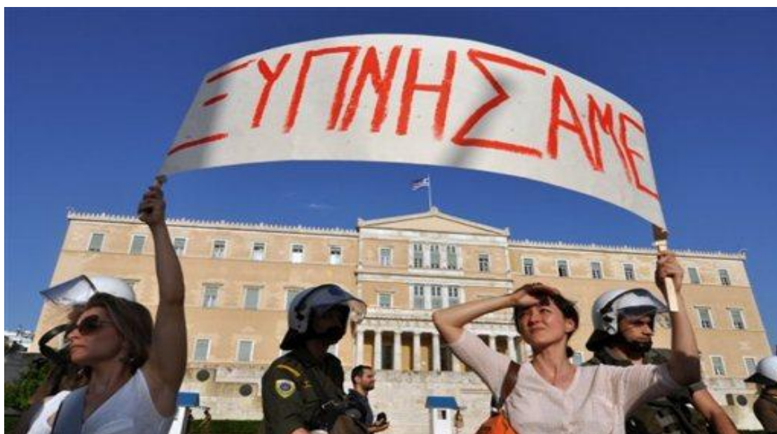
Εικόνα 20: Οι Έλληνες διαμαρτύρονται για τα μέτρα λιτότητας έξω από την Βουλή

Στις 29 Ιουνίου 2011 ψηφίστηκε από τη Βουλή των Ελλήνων το «Μεσοπρόθεσμο Πλαίσιο Δημοσιονομικής Στρατηγικής 2012-2015».