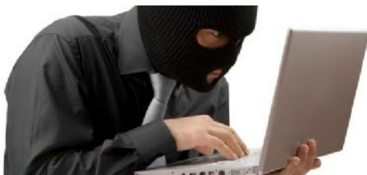
Εικόνα 5: Χάκερ, οι διαδικτυακοί εισβολείς

Όλα δείχνουν ότι αρκετοί χρήστες σε ολόκληρο τον κόσμο έχουν αρχίσει και χάνουν την υπομονή τους σχετικά με το πάντα επίκαιρο ζήτημα της απώλειας