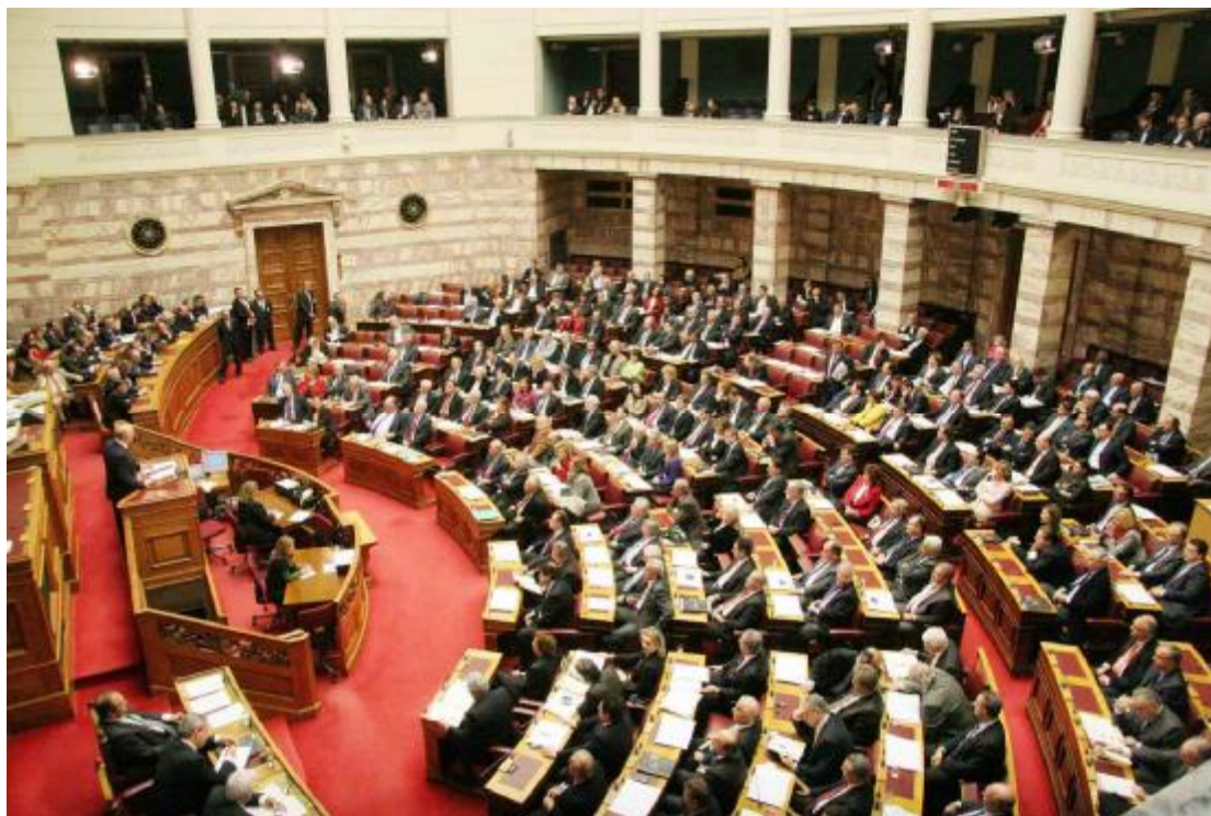
Εικόνα 19: Ψήφιση μνημονίου στη Βουλή των Ελλήνων

Στα τέλη του Ιανουαρίου του 2010, ο πρωθυπουργός της χώρας βρισκόταν στο Νταβός της Ελβετίας για το ετήσιο Παγκόσμιο Οικονομικό Φόρουμ. Στη διάρκεια του δέχτηκε έντονες πιέσεις από ξένους ηγέτες για άμεση λήψη μέτρων. 66 Λίγο μετά την επιστροφή του από το Νταβός, στις 9 Φεβρουαρίου η κυβέρνηση ανακοίνωσε μέτρα για τον δημόσιο τομέα που περιλάμβαναν πάγωμα μισθών, περικοπές επιδομάτων 10%, περικοπές υπερωριών και οδοιπορικών. 67 Η ανακοίνωση προκάλεσε αντιδράσεις και μία πανελλαδική απεργία της ΑΔΕΔΥ στις 10 Φεβρουαρίου. 68