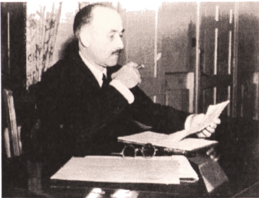
Jean Monnet: Διαπραγματευτής και Ειρηνοποιός, στόχος του η Ενωμένη Ευρώπη

Ο Robert Schuman, υπουργός εξωτερικών της Γαλλίας, σε ομιλία του, εμπνευσμένη από τον Jean Monnet, προτείνει την από κοινού εκμετάλλευση των πόρων άνθρακα και χάλυβα της Γαλλίας και της Ομοσπονδιακής Δημοκρατίας της Γερμανίας στα πλαίσια ενός οργανισμού ανοικτού στις άλλες χώρες της Ευρώπης.