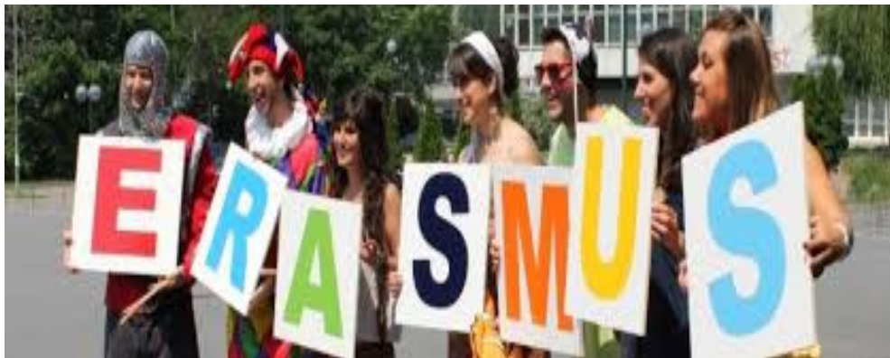
Εικόνα 3: Φοιτητές Erasmus σε κάποια χώρα της Ευρώπης