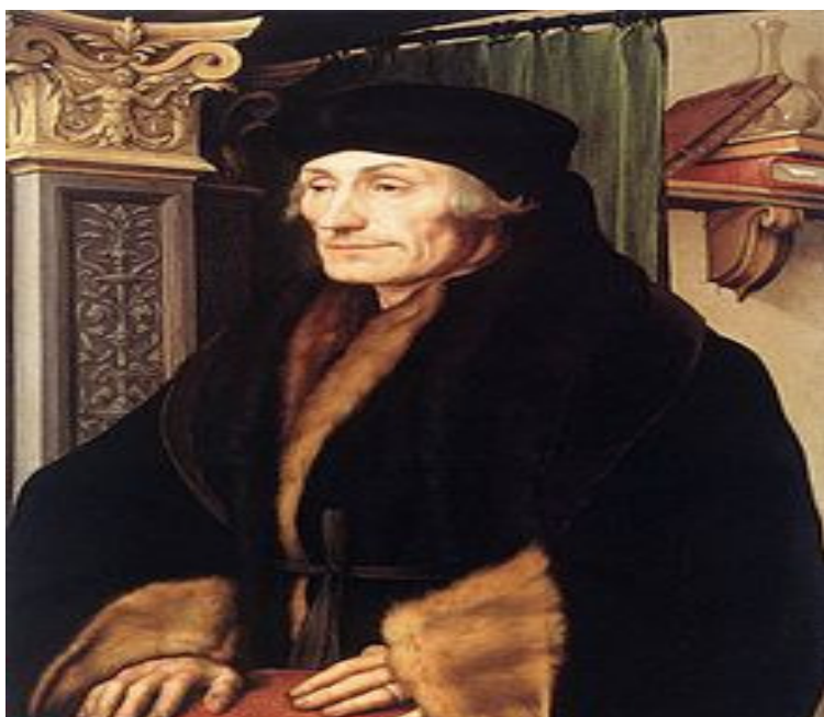
Εικόνα 1 Έρασμος: Πίνακας του Χόλμπαϊν

Το Erasmus δεν δέχτηκε αμέσως την υποστήριξη από όλα τα τότε κράτη μέλη της Ευρωπαϊκής Επιτροπής, καθώς χώρες όπως η Αγγλία, η Γαλλία και η Γερμανία έχοντας ήδη δικά τους προγράμματα ανταλλαγής τάχθηκαν κατά του προγράμματος.