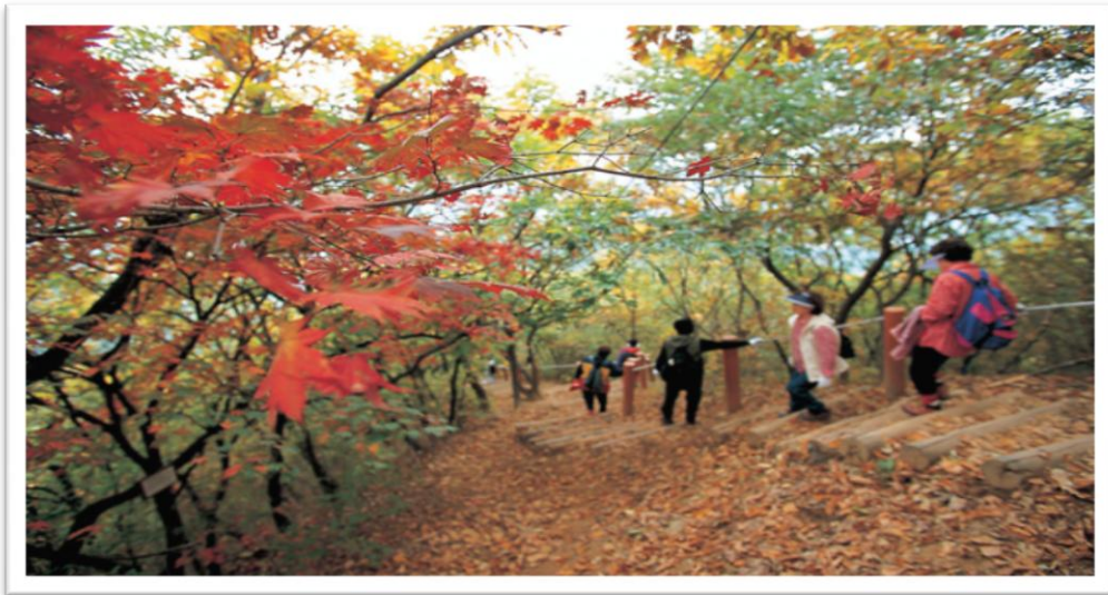
Εικόνα 4 – Εναλλακτικός τουρισμός κατά το φθινόπωρο

Το αντίπαλο δέος δε, ο εναλλακτικός τουρισμός, χαρακτηρίζεται από την ευαισθησία που επιδεικνύει για το φυσικό περιβάλλον, την προστασία των φυσικών πόρων στις περιοχές που πραγματοποιείται εναλλακτικός τουρισμός και τη βαρύτητα που δίνει στον ντόπιο πληθυσμό και την ανάπτυξη της τοπικής κοινωνίας. Μετράει λίγο χρόνο ζωής σε σύγκριση με τον μαζικό τουρισμό, γνωρίζοντας όμως μεγάλη άνθηση τα τελευταία χρόνια. Ο εναλλακτικός τουρίστας επιθυμεί την αποστασιοποίηση από τον μαζικό τουρισμό και τις αρνητικές επιπτώσεις που αυτός επιφέρει και επιζητά ταξίδια σε περιοχές φυσικού κάλους, με ιδιαίτερο κίνητρο και ανάγκες. Επιπλέον, σε αντίθεση με το πρότυπο τουρίστα του μαζικού τουρισμού, ο εναλλακτικός τουρίστας δεν μπορεί να θεωρηθεί ούτε πελάτης ούτε καταναλωτής, καθώς δεν μετέχει της όλης διαδικασίας που απαιτεί ο μαζικός τουρισμός ( κράτηση εισιτηρίων, προπληρωμή μέρους ταξιδιωτικού πακέτου κλπ.). Επισκέπτεται μέρη απάτητα από ανθρώπινο πόδι, διεγείρεται από το αίσθημα της περιήγησης, δεν αναζητά ειδικές τουριστικές υποδομές και είναι ανοιχτός στη σύναψη επαφών με τους ντόπιους κατοίκους.