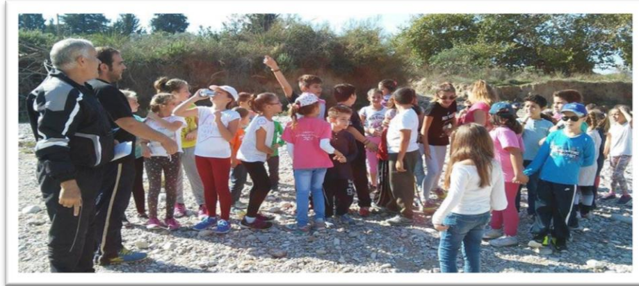
Εικόνα 6 – Μαθητική εκδρομή στη φύση