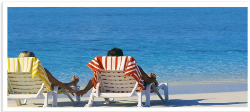
Εικόνα 7 – Διακοπές σε ελληνικά νησιά

Σε ανταπόδοση όμως των χρημάτων που διαθέτει για τις διακοπές του ο τουρίστας, η παροχή των προσφερόμενων τουριστικών υπηρεσιών οφείλει να βρίσκεται σε υψηλά επίπεδα. Ένας ποιοτικός συνδυασμός υπηρεσιών που αφορά σε ταξιδιωτικά πρακτορεία, μέσα μεταφοράς, ξενοδοχειακά συγκροτήματα, εστιατόρια κλπ. οδηγεί στην ικανοποίηση του τουρίστα και συνεπώς στην αύξηση της επιθυμίας του για να επισκεφθεί εκ νέου τον προορισμό από τον οποίο έμεινε ευχαριστημένος. Η επαναληψιμότητα άλλωστε είναι κ ο απώτερος σκοπός του τουρισμού και πρέπει να επιδιώκεται συνολικά αποφεύγοντας την πρόσκαιρη και ευκαιριακή εκμετάλλευση του τουρίστα, θεωρώντας τον είτε ανίδεο είτε ευκολόπιστο. Ο σύγχρονος τουρίστας εξάλλου χαρακτηρίζεται από πλήρη ενημέρωση και πληροφόρηση των τόπων που επισκέπτεται και επιδιώκει την επίτευξη ποιοτικών διακοπών και ευγενικής αντιμετώπισης στο χώρο υποδοχής, σε αντίθεση με τα παλαιότερα πρότυπα τουρίστα που χαρακτηρίζονταν από σχετική άγνοια και αδιαφορία για το τι θα συναντήσει στον προορισμό που επέλεγε για τις διακοπές του.