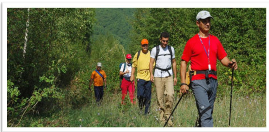
Εικόνα 2 – Οικότουρίστες