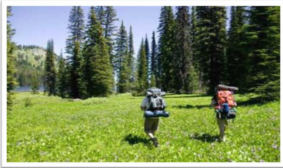
Εικόνα 3 – Πεζοπορία τουριστών