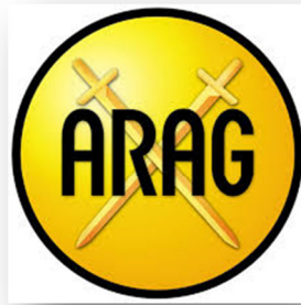
Εικόνα : στο ίδιο