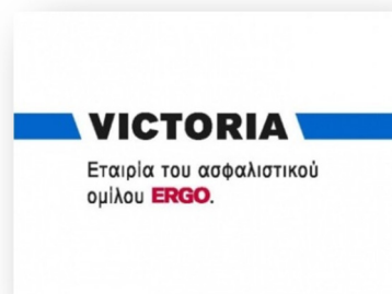
Εικόνα : στο ίδιο

Τα κεντρικά γραφεία της ασφαλιστικής εταιρείας βρίσκονται επί της οδού Βας. Σοφίας 97-115 21 Αθήνα. (στο ίδιο)