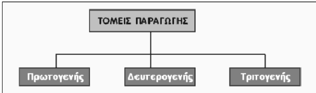
Σχήμα 2.1. Τομείς Παραγωγής

τον κλάδο οινοποιίας, υποδηματοποιίας, μεταλλουργίας, υαλουργίας, κλωστοϋφαντουργίας, τροφίμων και ποτών κ.ά. [25]