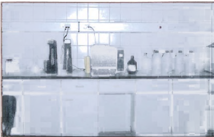
Εικόνα 3 Το εδαφολογικό εργαστήριο της Ένωσης του Νομού Δράμας.

Για την εκπλήρωση των σκοπών της η Ένωση :