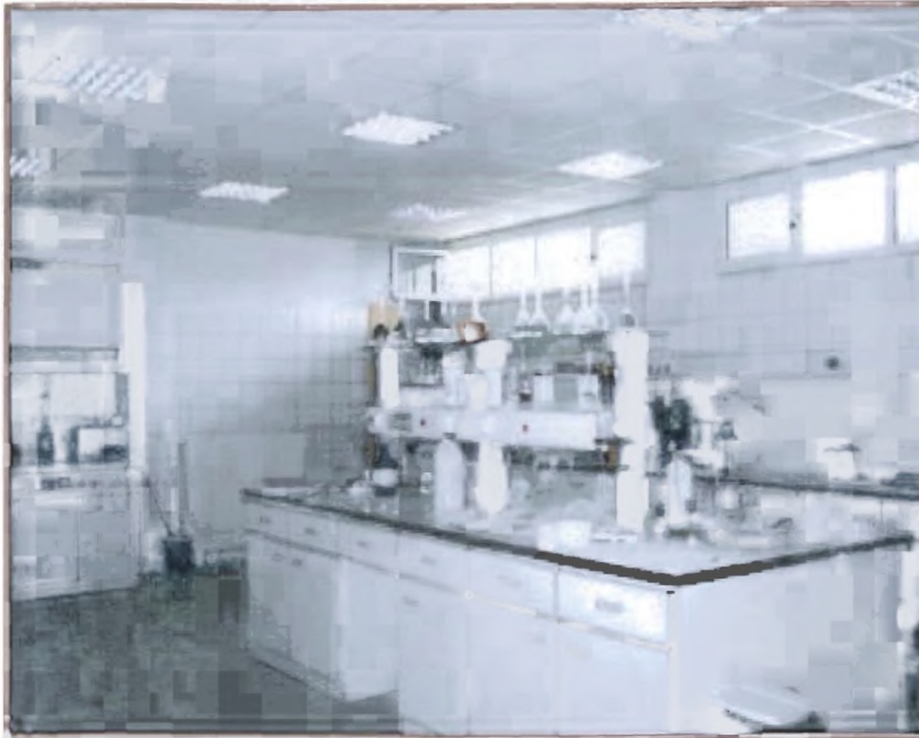
Εικόνα 2 Το εδαφολογικό εργαστήριο της Ένωσης του Νομού Δράμας.