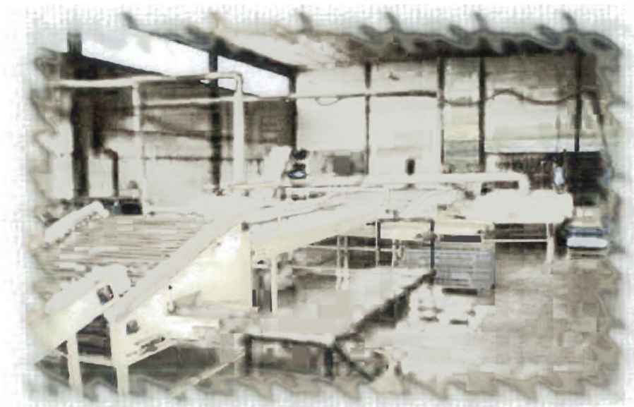
Εικόνα 1 Συσκευαστήριο πατάτας Νευροκοπίου.

Οργανώνει και παρέχει στα μέλη της κάθε είδους τεχνική βοήθεια (γεωργικά εργαλεία, ανταλλακτικά, λιπάσματα, γεωργικά φάρμακα, σπόρους) για την διευκόλυνση και βελτίωση της παραγωγής ή τη μείωση του κόστους της. Λειτουργεί συσκευαστήριο πατάτας στην περιοχή Νευροκοπίου, όπου συσκευάζεται άριστη πατάτα, στηρίζοντας το εισόδημα των παραγωγών της περιοχής.