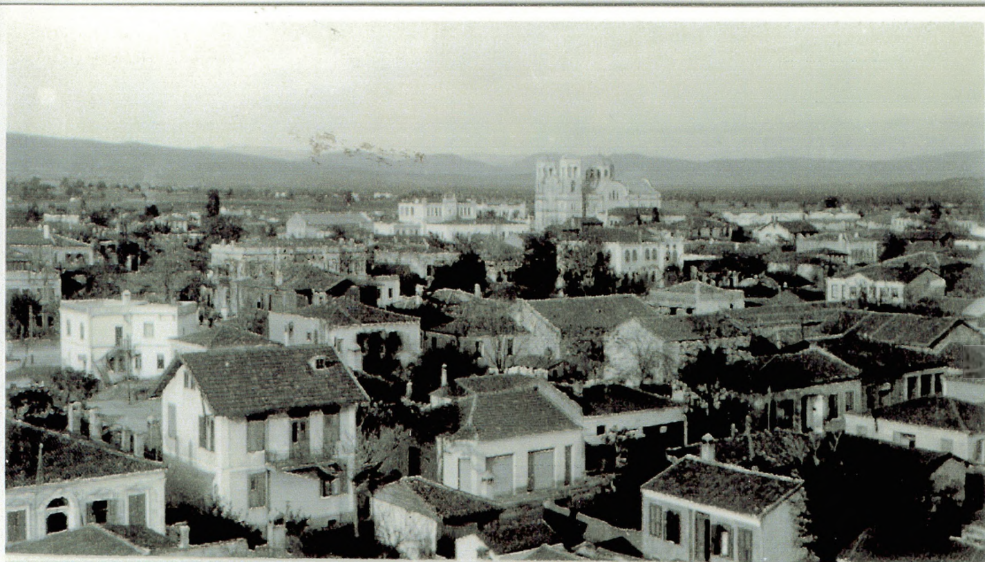
ΜΕΡΙΚΗ ΑΠΟΦΙΣ ΑΛΕΞΑΝΔΡΟΥΠΟΛΕΩΣ