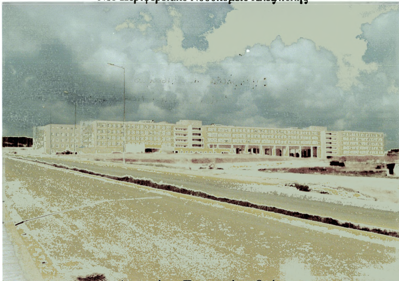
Δημοκρίτειο Πανεπιστήμιο Θράκης "Παιδαγωγική Ακαδημία"