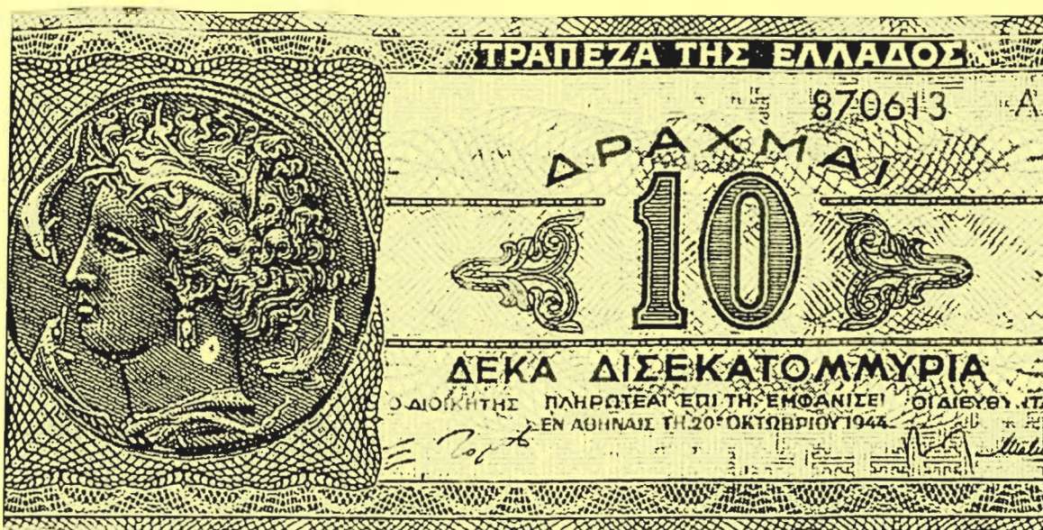
Πληθωριστικό χαρτονόμισμα 10 δισεκατομμυρίων δραχμών. Εκδόθηκε στις 20 Οκτωβρίου 1944 λίγες ημέρες μετά την απελευθέρωση και φέρει την υπογραφή του Ξ. Ζολώτα.