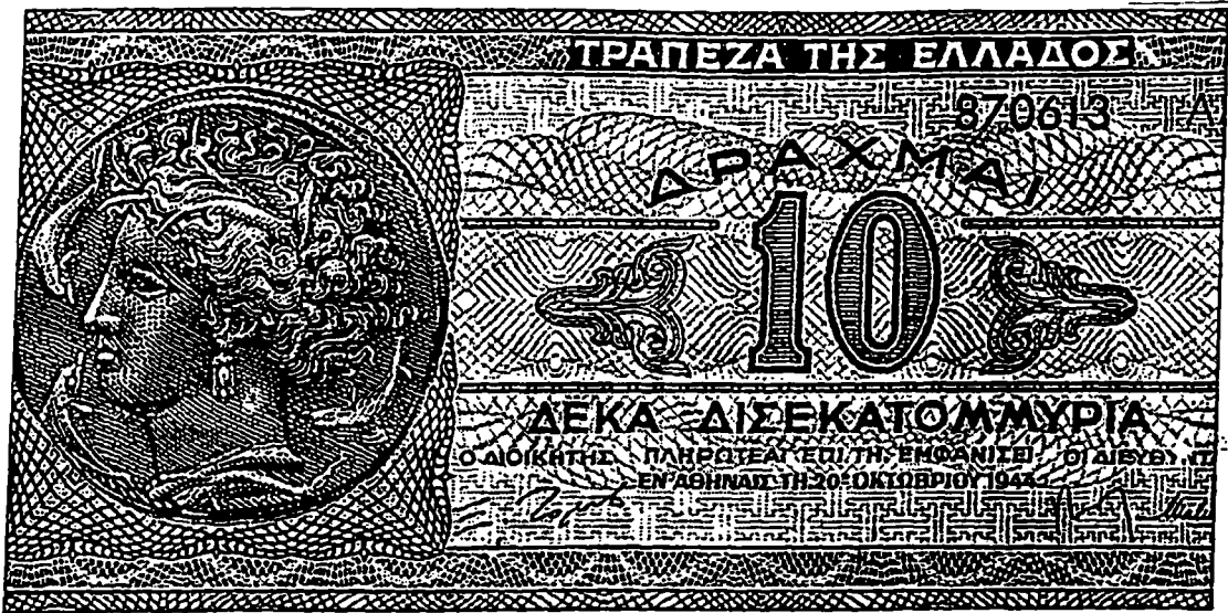
Πληθωριστικό χαρτονόμισμα 10 δισεκατομμυρίων δραχμών. Εκδόθηκε στις 20 Οκτωβρίου 1944 λίγες ημέρες μετά την απελευθέρωση και φέρει την υπογραφή του Σ. Ζολώτα.