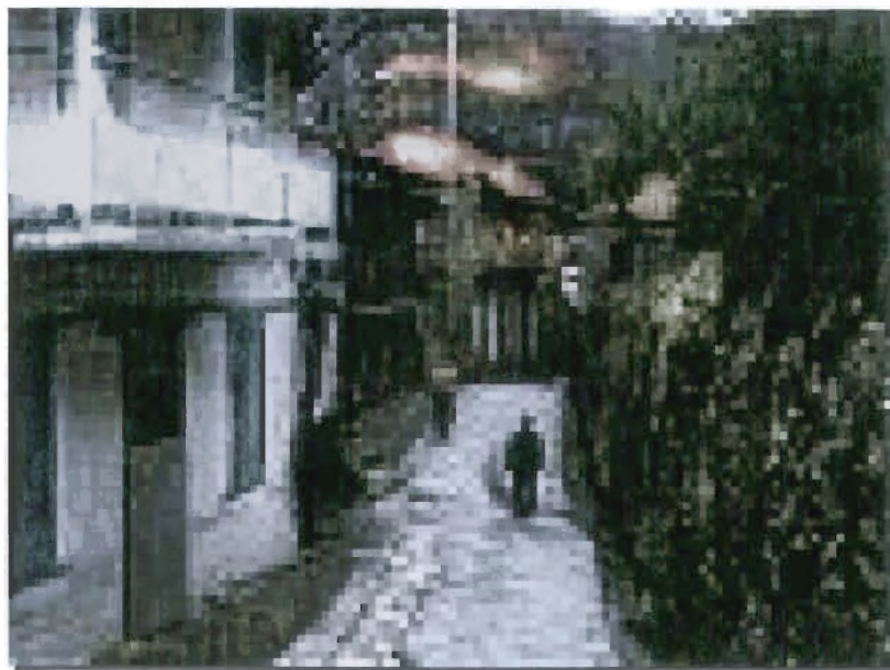
Φωτο 4, 5 : Άνω Χώρα