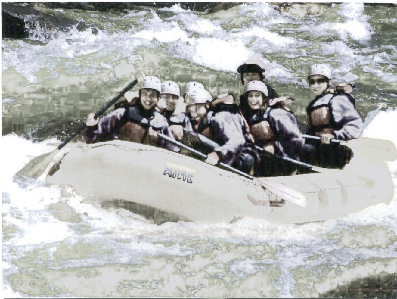
Rafting στον Εόηνο ποταμό

Το κόστος που απαιτείται γι' αυτές τις δραστηριότητες κυμαίνεται περίπου στα 50 ευρώ κατά άτομο και περιλαμβάνει επαγγελματίες οδηγούς ποταμού, τοπική μεταφορά, ελαφρύ γεύμα μετά την κατάβαση και όλο τον απαραίτητο εξοπλισμό.