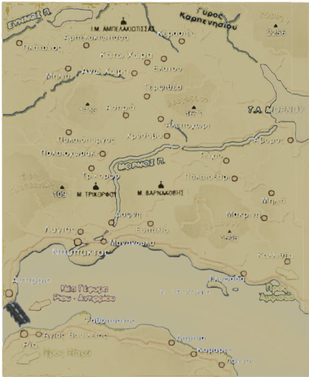
Φωτο. 1: Οδική πρόσβαση στην Ορεινή Ναυλακτία