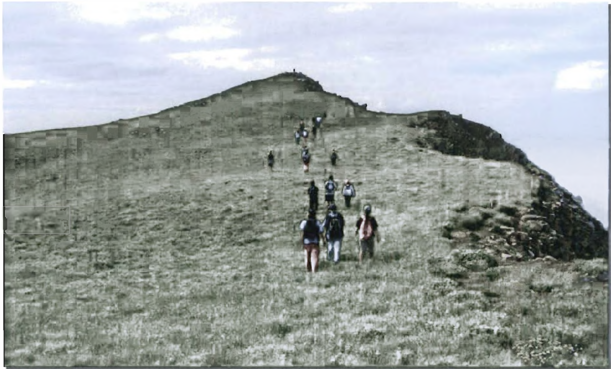
Φωτο 6, 7, 8: Αθλητικές δραστηριότητες στην Ορεινή Ναυπακτία