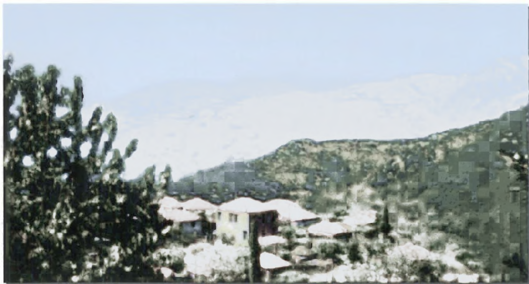
Φωτο. 2, 3: Οι πλαγιές της Ορεινής Ναυπακτίας