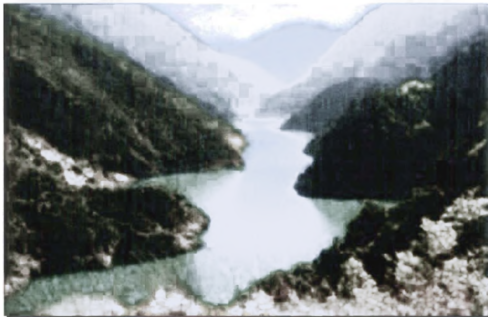
Φωτο 9 : Ο ποταμός Εύηνος